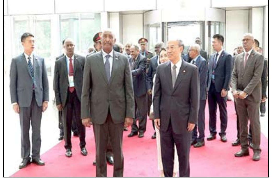
رئيس مجلس السيادة يزور مقر مجموعة «سي. ان. بي. سي»