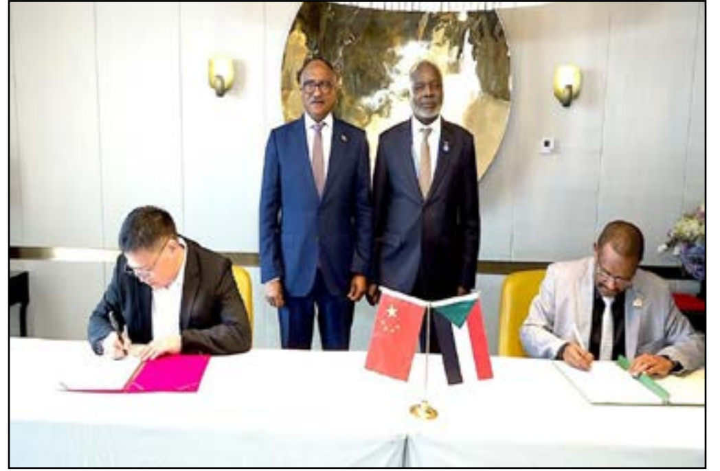
التوقيع على إتفاق بين مجموعة جياڤ الهندسية ومجموعة من الشركات الصينية العاملة في صناعة السيارات