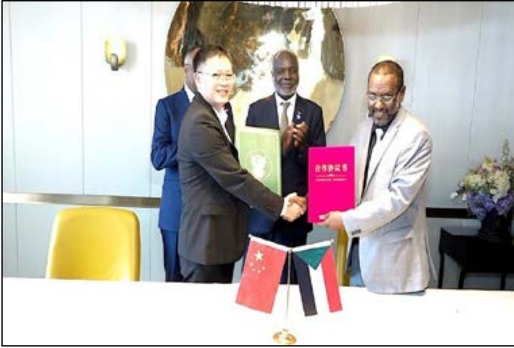
جبريل إبراهيم يشهد مراسم توقيع إتفاقية بين مجموعة جياڤ الهندسية ومجموعة الشركات الصينية العاملة في صناعة السيارات