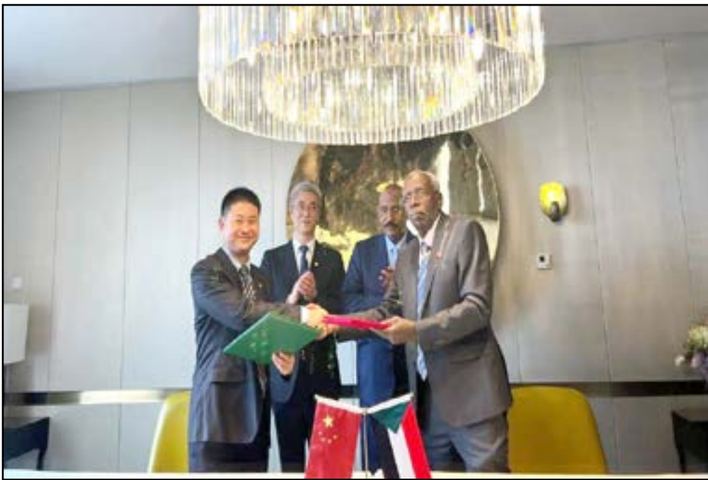
توقيع إتفاقية مشتركة في مجال الطاقة النووية وإنشاء المطارات والموانئ