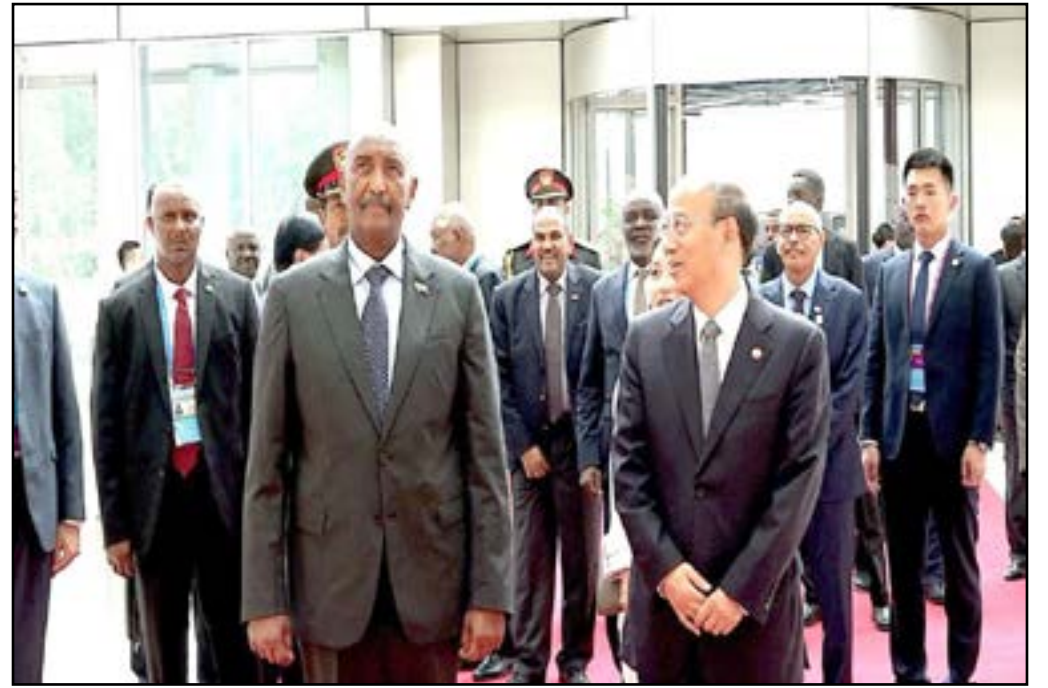
السيد داي هوليايق الرئيس التنفيذي للمجموعة مع البرهان