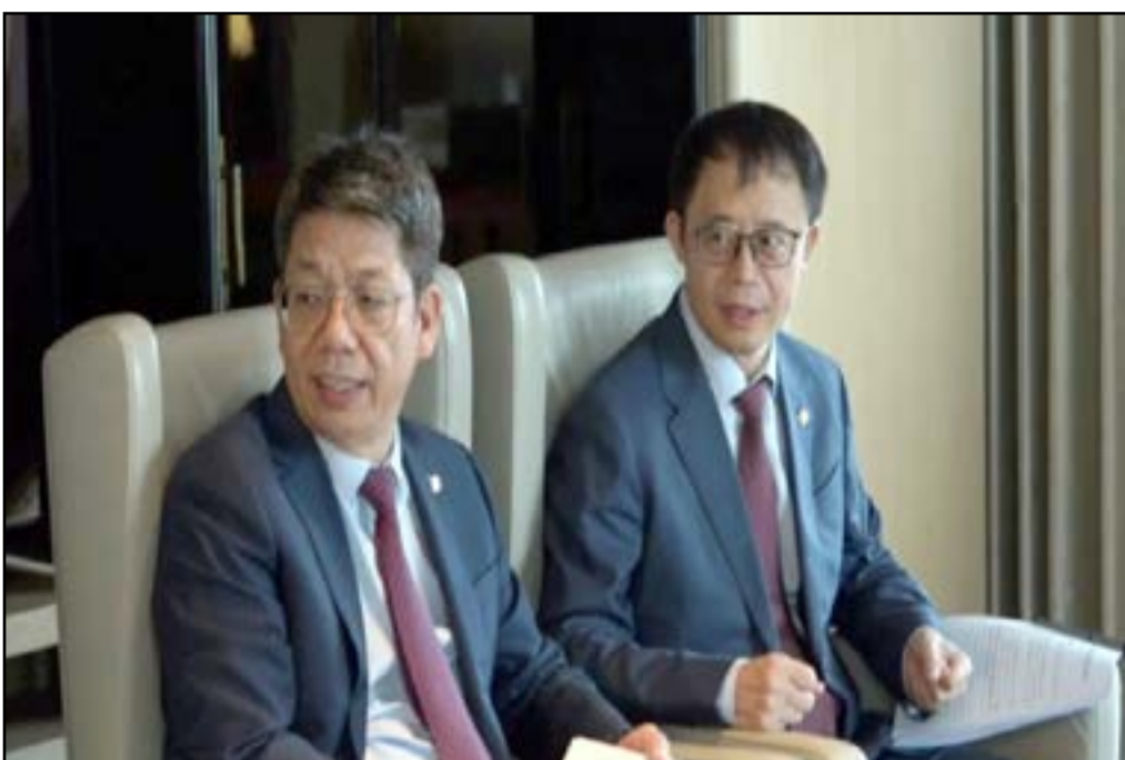
توقيع مذكرات تفاهم في مجال التعدين لإستخلاص المعادن النفيسة مع مؤسسات صينية