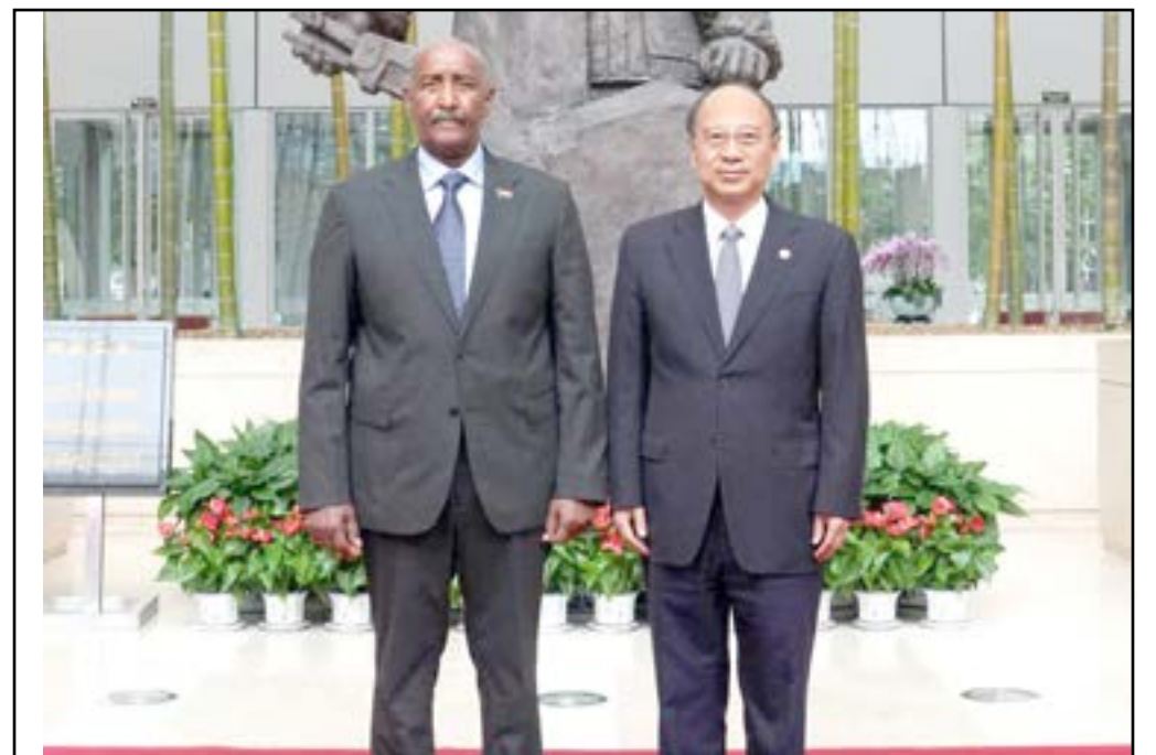
البرهان يؤكد على أهمية استمرار العلاقات الاقتصادية بين الصين والسودان