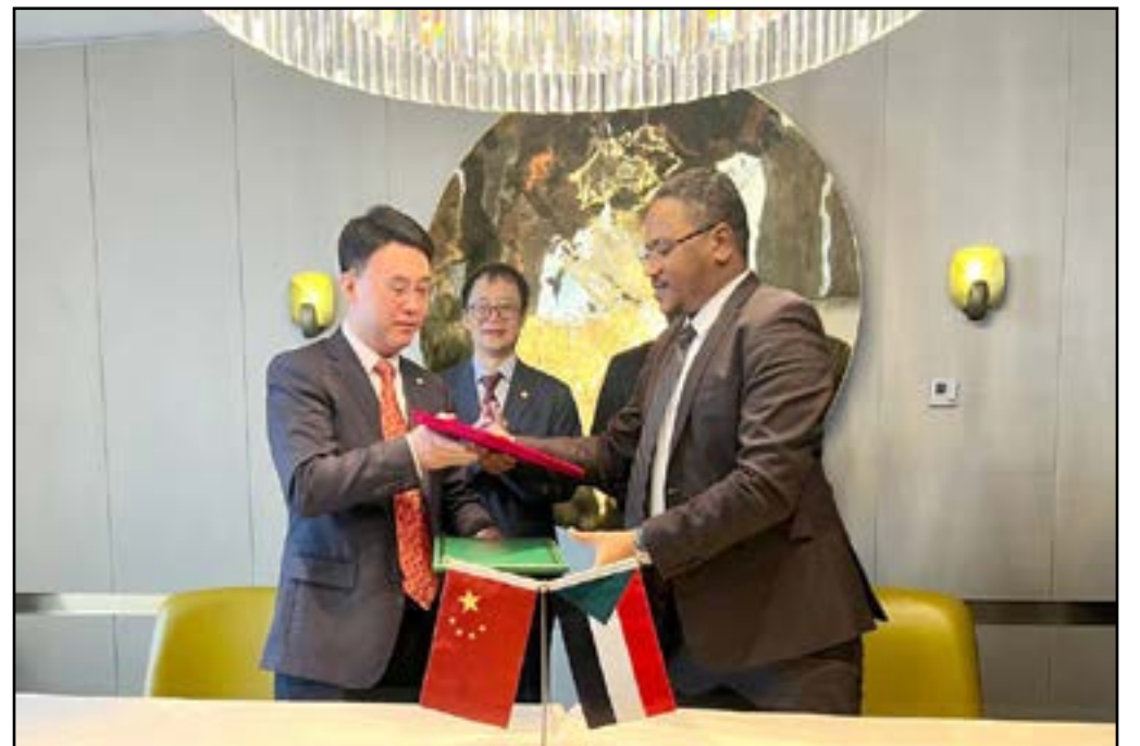
توقيع إتفاقية في مجالات الطاقة الشمسية والتعدين وخطوط النقل