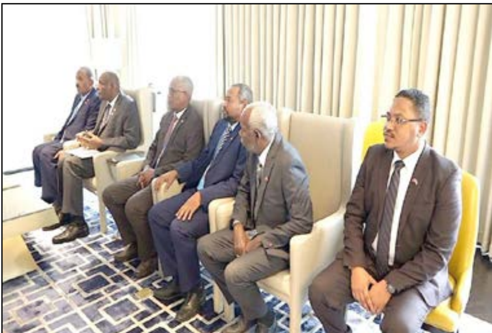
منظومة الصناعات الدفاعية مع شركات «جاينا إينرجي»