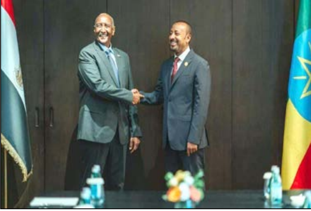
رئيس مجلس السيادة الانتقالي مع رئيس الوزراء الأثيوبي