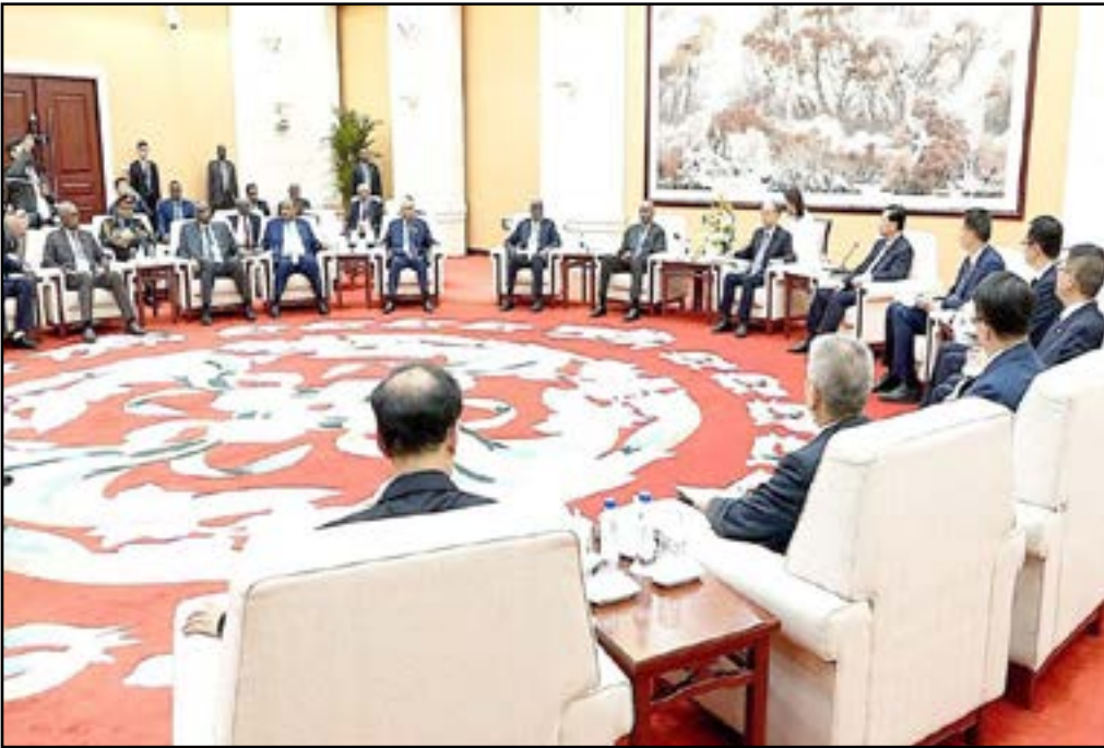
وفد السودان يقف على تجربة شركة «سي. ان. بي. سي» في مجال النفط