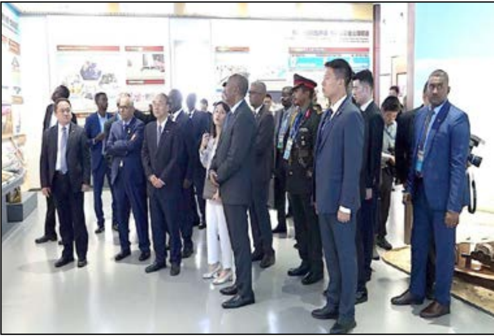
وفد السودان يقف على تجربة شركة «سي. ان. بي. سي»