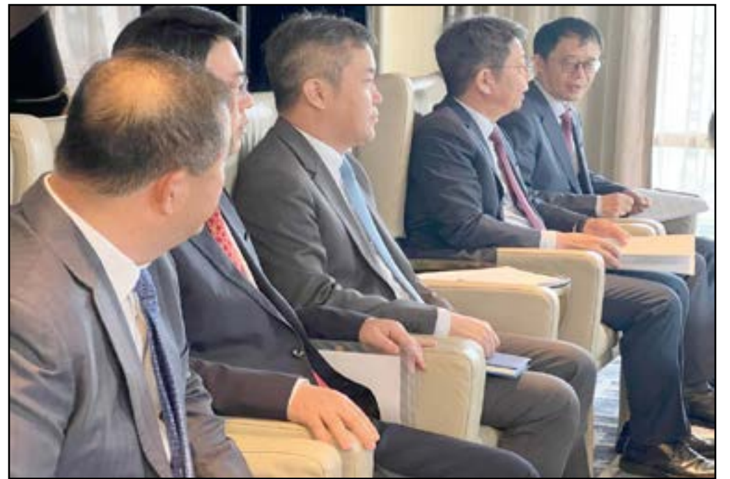
توقيع إتفاقية بين السودان والصين لتطوير القطاع الزراعي