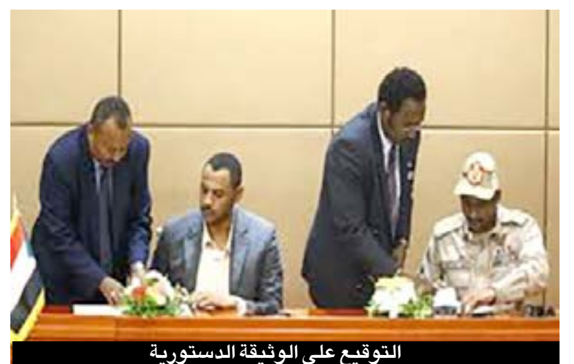
التوقيع على الوثيقة الدستورية