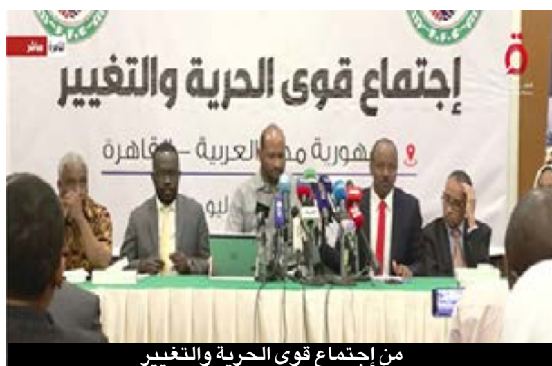
من إجتماع قوى الحرية والتغيير

كنت في سكرتارية الطلاب الشيوعيين، وعضو المكتب الثقافي للحزب الشيوعي وقتها كنت في الجامعة