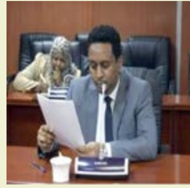
والمدن والمخططات والتجمعات لاستيعاب أكبر فئة من المستفيدين والمطورين العقاريين عبر منح

حواجز للمستثمرين في هذا القطاع لتشجيعهم لضخ المزيد من رؤوس الأموال مع العمل على تصدير العقار للخارج وبما يسهم في تيسير تملك الأجانب للعقارات وحتى حصولهم على الجنسية المصرية وقال في تصريح ل (أصداء سودانية) أن دخول السودانيين للإستثمار في القطاع العقاري المصري لم يبدأ عند اندلاع الحرب في الخامس عشر من أبريل 2023 وإنما سبقه بسنوات، وذلك لأسباب عدة جعلت المستثمر والمواطن السوداني يتجه للإستثمار في القطاع العقاري