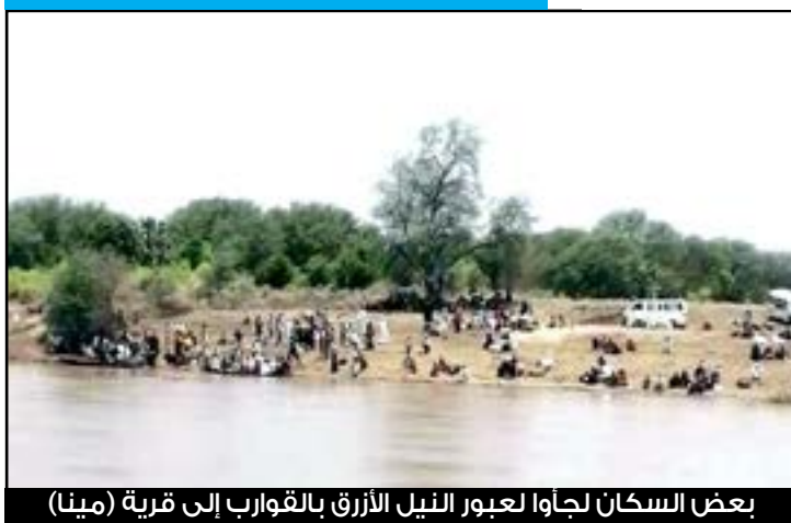
بعض السكان لجأوا لعبور النيل الأزرق بالقوارب إلى قرية (ميننا)