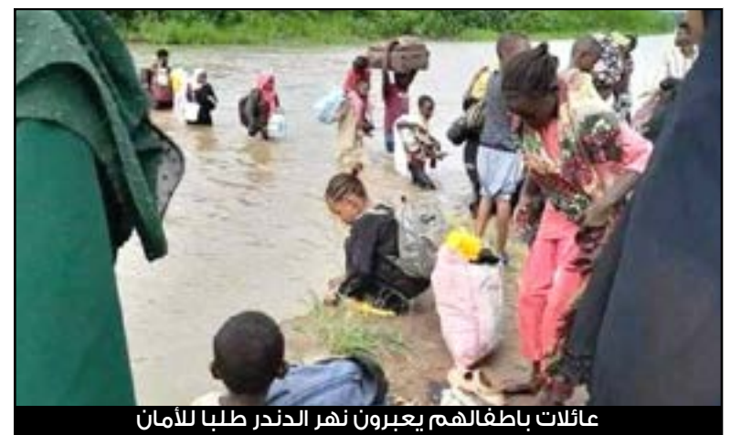
عائلات باطفالهم يعبرون نهر الدندر طلبا للامان