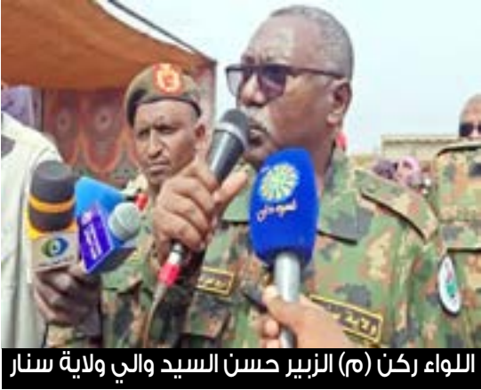
اللواء ركن (م) الزبير حسن السيد والي ولاية سنار

إقالة مدير عام وزارة التربية والتوجيه ولاية سنار