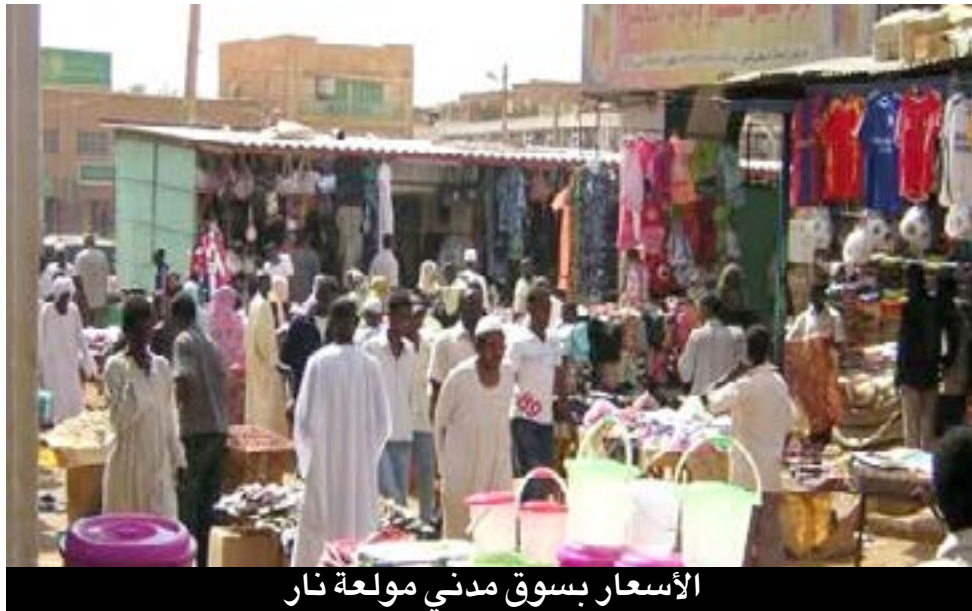
الأسعار بسوق مدني مولعة نار

حتى يعود المواطنين من الخارج ومن الولايات الأخرى لمنازلهم لابد من وضع استراتيجيات لهذه العودة، من ضمنها كبح جماح الأسواق، وحسم سماسرة المواد الغذائية والإيجارات الذين يتحركون في كل الاتجاهات دون رقيب او حسيب، فضلا عن حسم جبايات الارتكازات التي تقع على الطرق القومية وفي مداخل المحليات والتي أرهقت المواطنين كثيرا.. فضبط الأسعار وتحجيم جشع تجار الأزمات إجراء ضروري في هذه المرحلة الإستثنائية التي تمر بها البلاد