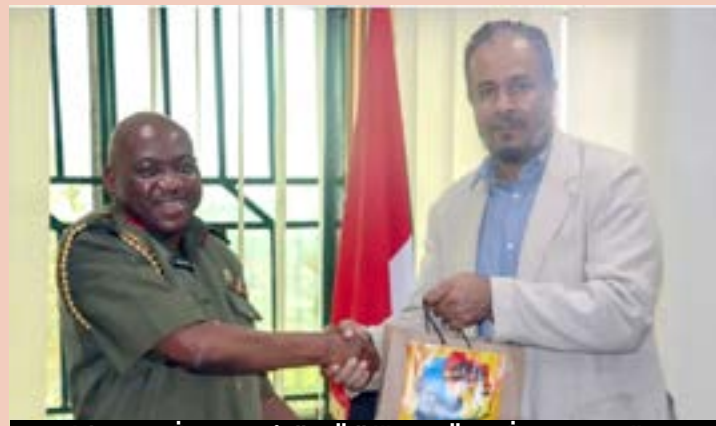
الإماراتي مالك شركة المرتزقة وقائد الجيش اليوغندي