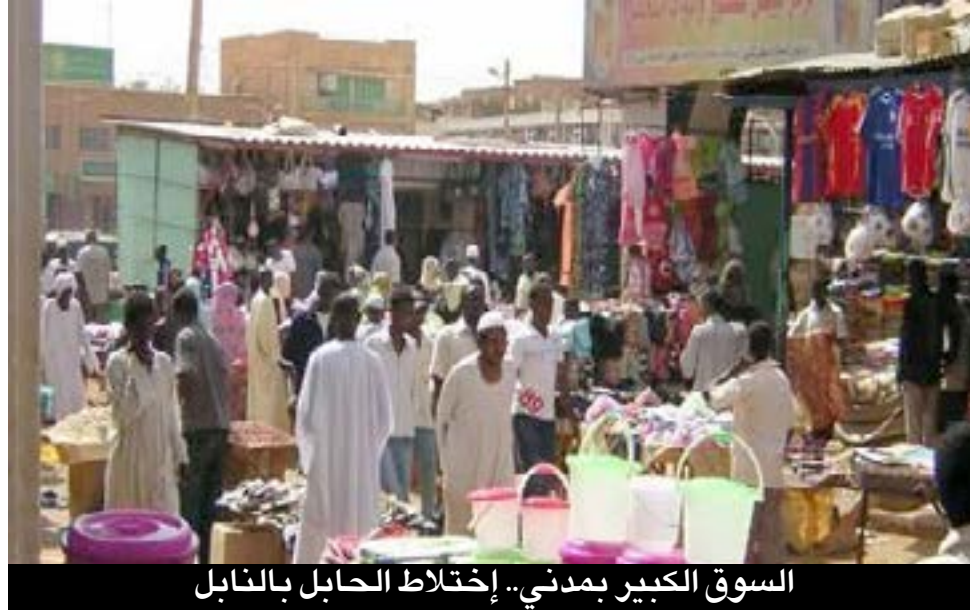
السوق الكبير بمدني.. إختلاط الحابل بالنابل

النفائيات بالولاية تعمل وفق الإيقاع الاقتصادي العام والعمل التنظيمي بالولاية، وحقيقة حجم النفائيات بسوق مدني الكبير عموماً كبير نسبة لحجم الأنشطة التجارية المختلفة داخل الأسواق، رغم ذلك لدينا تنسيق مع عدد من الإدارات ذات الصلة بالأمر من أجل نقل النفائيات الى خارج المدينة عبر مكب آخر.. وهناك مقترح آخر وهو تدوير النفائيات، وهذا الامر موضوع كخطة.. فالنفائيات وبكل المقاييس تعد واحدة من قضايا السوق، ونسعى لتنظيمها بصورة جيدة ولائقة وإستغلال مكب نفائيات السوق الحالي بصورة يستفيد منها الجميع تنظيمياً وصحياً وبيئياً.. ولدينا معالجات في هذا الشأن من قبل الولاية، كما ان لدينا خطة من أجل فتح المجاري ونظافتها وبداناً فيها بالفعل