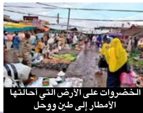
الخضروات على الأرض التي أحتلتها الأمطار إلى طين ووحل

إتخذت هذا الموقع كفترة مؤقتة لحين معالجة قضيتنا من قبل المحلية او المواصفات وتخصيص أماكن ثابتة