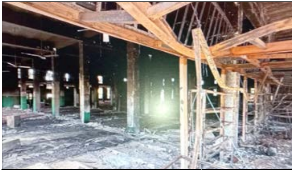
المليشيا أحرقت مسجد بحري الكبير بالكامل

مسجد بحري الكبير الواقع بقلب سوق الخرطوم بحري يعد أحد المعالم الإسلامية العريقة بالعاصمة الخرطوم، وهو الآخر لم يسلم من بطش (المهاويش) وحقدهم.. المسجد للأسف تدمر دمارا كاملا.. المليشيا قامت بحرق كل سجاد المسجد، وإتلاف عدد كبير من المصاحف.. كما كانوا يدخلون سياراتهم القتالية لباحاته ليلا.. شهود عيان أكدوا لي أن أفراد المليشيا