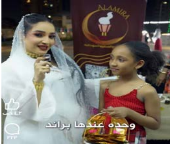
وحده عندها براند

ودعما واعجابا بروعة الحلوى التي تصنعها، وبقلب يسع العالم، صنعت منتجها بخطوة جريئة واثقة لمجهودها وإبداعها الملهم