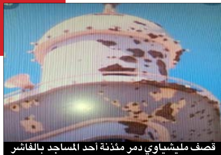
قصف مليشياوي دمر مئذنة أحد المساجد بالفاشر