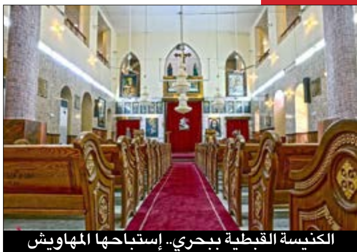
الكنيسة القبطية بحري.. إستباحها المهاويش

شهود عيان نزحوا من مدينة الفاشر أوضحوا للصحيفة أن المليشيا قصفت متعمدة مسجدا بحري التيجانية شرقي الفاشر مما أدى لإستشهاد 8 أشخاص من عائلة واحدة