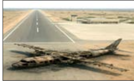
طائرة النقل الإماراتية بعد حرقها بمدرج الهبوط بمطار نيالا

بأجهزة ومعدات مختلفة وعلى متنها أكثر من 40 من المرتزقة الأجانب من بعض الدول الأفريقية جندتهم الإمارات عبر شركات أمنية خاصة، بجانب عدد من الخبراء من دولة كولمبيا متخصصين في المسيرات وأجهزة التشويش، وبعضهم تم جلبهم لتدريب عناصر الدعم السريع وتعزيز قدراتهم القتالية، وكانوا في