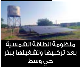
منظومة الطاقة الشمسية بعد تركيبها وتشغيلها ببر حي وسط

بعد مرور 66 يوما من التخطيط والعمل الدؤوب إكتمل حلم أهلنا بقرية أم سنط، وحدة كركوج الإدارية، محلية السوكي، ولاية سنار، حيث إكتملت فصول الملحمة الشعبية الرائعة غير المسبوقة وتكملت خواتمها بضخ المياه لسكان القرية الوادعة الجميلة التي ترقد في دلال على ضفة النيل الأزرق.. هذا المشروع الذي ولد من رحم المعاناة، هو ليس مجرد مشروع فقط بل، هو قصة عشقها أهلها وسقوها من عروقهم، وأمنوا أنها تستحق