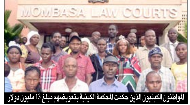
المواطنون الكينيون الذين حكمت المحكمة الكينية بتعويضهم مبلغ 13 مليون دولار

لا تنمية ولا إقتصاد ولا صحة بدون بيئة سليمة.. والتدخلات أضرت بالبيئة السودانية