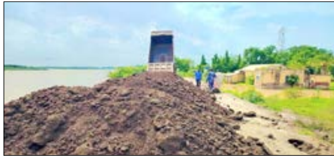
العمل جاري في تقوية الجسر