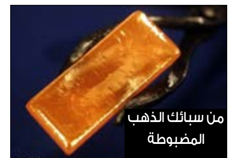
من سبائك الذهب المضبوطة

تفيد مصادرنا بولاية نهر النيل أن الإدارة العامة للمباحث الجنائية المركزية بولاية نهر النيل فرعية عطبرة ضبطت 12 سبيكة ذهب، وكمية من الذهب المشغول وزنه حوالي 654 جرام، لدى أجانب يديرون ورشة لتصنيع الذهب بسوق عطبرة ويستلمون سبائك ذهبية من الصاغة لإعادة تصنيعها وتشكيلها، بواسطة