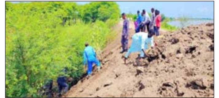
ردم الفجوة التي تسببت فيها الأمطار

ترتيبات عاجلة للإستمرار في تقوية الجسر، بجانب تشديد الرقابة من الدفاع المدني الذي نعلم أن بعض أفراده يرابطون بصفة دائمة على النهر لمراقبة الجسر وإحتواء أي خلل محتمل فيه.. وللمواطنين القاطنين جوار الجسر دورا كبيرا في أعمال المراقبة خاصة أثناء هطول الأمطار.. كما نناشد سكان الحي الشرقي المتاخم للجسر عدم أخذ التراب من الجسر لحماية منازلهم من الأمطار والسيول خشية إضعافه