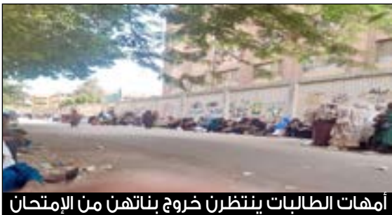
أمهات الطالبات ينتظرن خروج بناتهن من الإمتحان

مشهد مؤثر لأمهات الطالبات الجالسات للشهادة المتوسطة أمام أحد مراكز الإمتحان المنتشرة بالعاصمة المصرية القاهرة ترقبا وإنتظارا لبناتهن للإطمئنان عليهن.. أنه حنان الأمهات