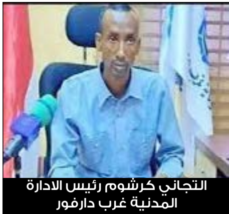
التجاني كرشوم رئيس الادارة المدنية غرب دارفور