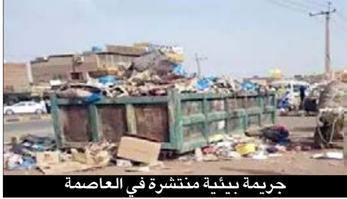
جريمة بيئية منتشرة في العاصمة

محكمة ممبسا تغرم الحكومة الكينية 13 مليون دولار أمريكي تعويضا عن أضرار لحقت بمواطنين جراء تسمم بالرمصاص