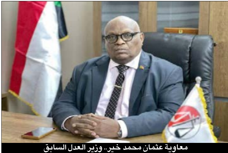
معاوية عثمان محمد خير.. وزير العدل السابق

المحكمة العليا، دائرة الطعون الإدارية في قرارها الذي بموجبه قضت بشطب الطعن المرفوع ضد رئيس مجلس السيادة ووزير العدل السابق.. ومن خلال نظر المحكمة العليا للطعن وجدت انه قصد منه إلغاء قرار الترقية الذي بموجبه تم ترقية عدد (49) مستشار إلى درجة مستشار عام.