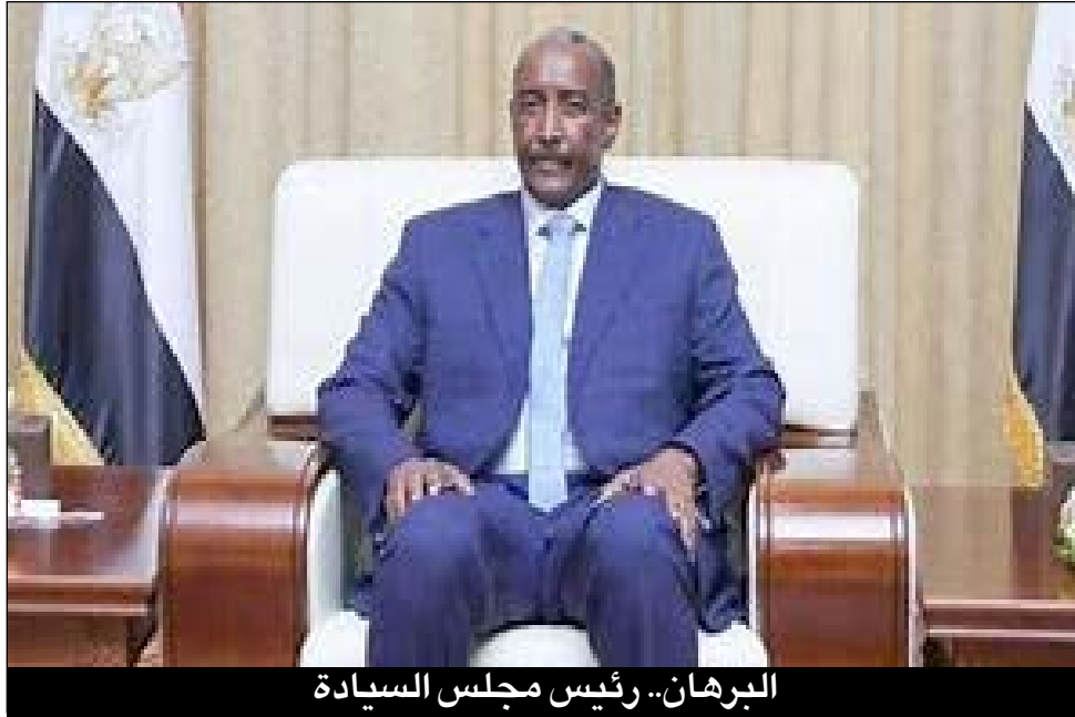
البرهان.. رئيس مجلس السيادة

- طالما ان رئيس مجلس السياسة اتخذ القرار بتوصية من وزير العدل فالقرار ظاهرياً سليم ولا يجوز الطعن فيه الدرس المستفاد من هذه القضية هو ان القضاء السوداني ابوابه مشرعة للطعن في اي قرار ولو صدر من رئيس مجلس السيادة.. ونأمل الا يضار المستشارين الذين تقدموا بالطعن، بحيث يستمرون في عملهم كالمعتاد