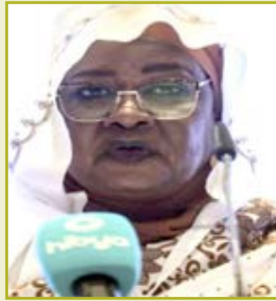
الخاص مع نظرائه في دولة البرازيل كما

ويشهد الملتقى معرضا مصاحبا مشيرة الي اهمية الفعالية في جذب للمستثمرين للاستثمار في مشاريع إعادة اعمار ما دمرته الحرب واعتبرت الملتقى فرصة لكافة القطاعات للخروج بشراكات ذكية من شأنها الدفع بعجلة الاقتصاد وقطعت احلام باهمية مشاركة القطاع الخاص والتي تشكل تكاملا للدوار مع الجهاز القومي للاستثمار وفق خطته الاستراتيجية فهو يقود التنمية جنبا إلى جنب مع الجهاز القومي للاستثمار وقالت سعى الجهاز القومي للاستثمار إلى خلق شراكات حقيقية مع القطاع الخاص لتحريك كافة القطاعات الانتاجية من أجل