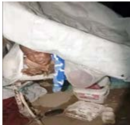
نازحة مريضة بالسكري تشكو حالها للوالى