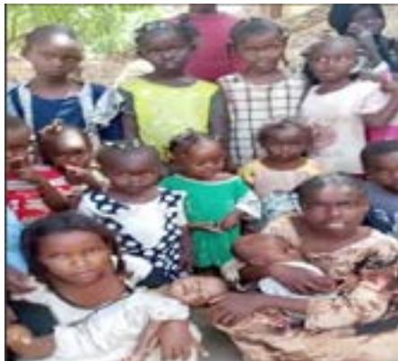
الأطفال النازحون.. نظرات حائرة