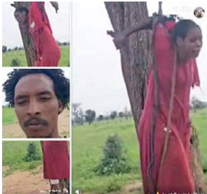
شهيدة الشجرة (قسمة) التي أثارت الضمير العالمي (الحي)

حُظي بمتابعة الملايين حول العالم، ان الجرائم التي إرتكبتها المليشيا في