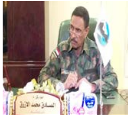
اللواء ركن (م) الصادق محمد الأزرق والى كسلا المكلف

وقفت الصحيفة وأمهاتهم على الأوضاع الصعبة للأطفال وأمهاتهم، حيث أنهم يقيمون في العراء قرب طريق عام داخل (كرانك) أقاموها من جوالات البلاستيك لا تحميهم من الأمطار والرياح التي تطيح بها ليجدوا أنفسهم مباشرة تحت الأمطار والتي أتلقت المواد التموينية القليلة والمتواضعة التي كانت بحوزتهم التي بحوزتهم.. ممثلة الأمهات صرحت للصحيفة بقولهن في ظل عدم الاهتمام بنا وبأطفالنا خاصة أن من بيننا كبار سن ومرضى وحوامل، قررنا وضع أطفالنا الصغار امام مكتب والى كسلا ليقوم بتحمل مسؤولياته تجاههم.. ورغم علمنا بتحرير الخرطوم إلا أننا لا نستطيع العودة لضيق زاد اليد، وهناك مطلقات ونساء لا يعرفن مكان تواجد أزواجهن.. كل ما نطلبه ضمنا لمعسكر الكرامة حتى يقضي الله امرا كان مفعولا (حاضرة المسؤول) بعد ان وقفت