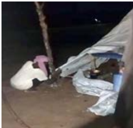
أم تحاول تثبيت كوخها البلاستيكي لحماية أطفالها من الأمطار

على الأوضاع (المُبكية) لهؤلاء الأطفال وأمهاتهم تناشد والى ولاية كسلا اللواء ركن معاش، الصادق محمد الأزرق، التدخل لمساعدتهم بتخصيص ماوى لهم، ويمكن إلحاقهم بمعسكري إيواء النازحين بمصنع البصل وغرب مطار