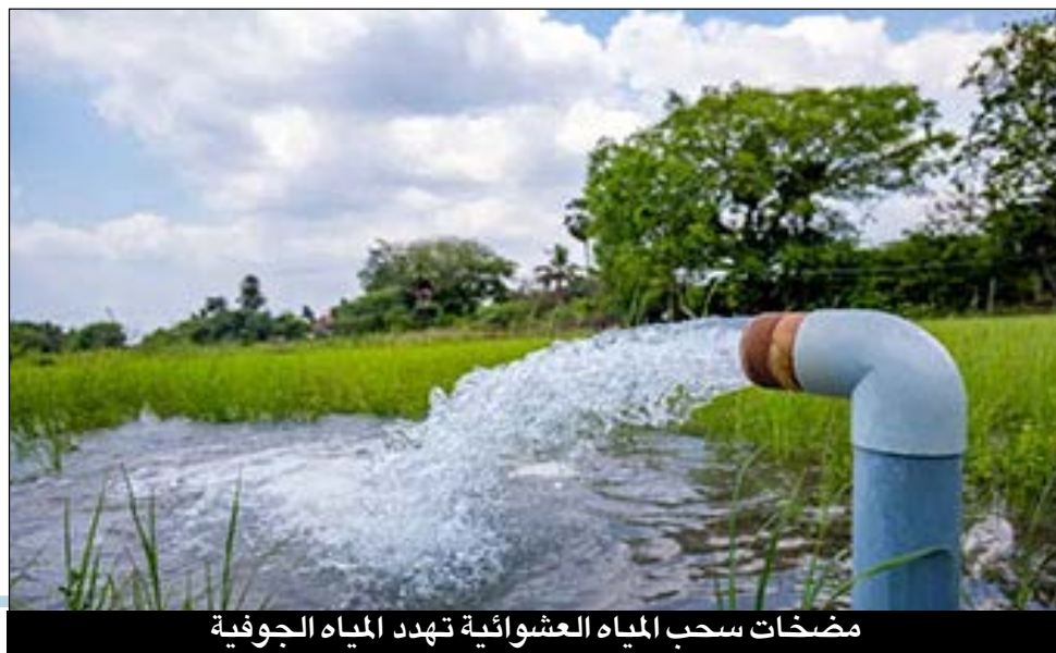
مضخات سحب المياه العشوائية تهدد المياه الجوفية

لا يجوز لأي شخص إستخدام مضخة او غيرها من الوسائل لسحب المياه من المياه الجوفية للري او الشرب او الصرف الصحي او الصناعي، ما لم يحصل على الترخيص اللازم من الوزارة.. حيث ثبت ان السحب الزائد للمياه الجوفية يتسبب في إنخفاض منسوب المياه الجوفية، وهبوط الأرض، وخسارة المياه السطحية التي تغذي جداول الخزانات الجوفية العملاقة