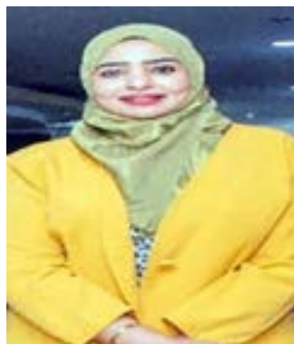
التحقيق المنشور بـ(أصداء سودانية) الخميس ٩ أكتوبر

كما أشادت الموظفات بقسم تسليم الجوازات الإلكترونية السودانية ببيت السودان، والذي يتبع لإدارة الجوازات بسفارة السودان بالقاهرة بالتحقيق الصحفي، مشيرات: التحقيق الصحفي غطى وعكس الجهد المبذول والعمل الكبير والمهم الذي تقوم به إدارة الجوازات بالسفارة وبيت السودان، وحرصها التام لتسليم كل صاحب جواز جوازه بالدقة والسرعة والتوقيت المحدد.. شكرا لكم على هذا العمل الصحفي الرائع والمميز