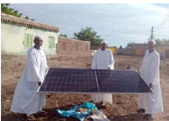
شراء منظومة للطاقة الشمسية لتشغيل آبار القرية.. نموذج مشرق لتكافل أهل ام سنط

أم سنط.. مجتمع يتنادى عند الشدائد ويتسابق في الخيرات