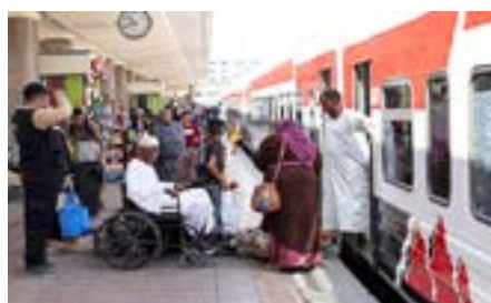
نازحون سودانيون يغادرون القاهرة عبر (قطار الشوق)

أيها المغتربون، أنتم حراس الكرامة، يا من تحملتم الغربة والبعد والحرمان، أنتم لستم فقط أفراداً يرسلون المال، أنتم خط الدفاع الأول عن كرامة السودان.. أنتم الذين أثبتتم أن هذا الوطن لا ينكسر، حتى لو اجتمع عليه المتآمرون في الداخل والخارج.. وإننا نعدكم، أن معركتنا القادمة ضد كل من يحاول أن يهدر عرقكم أو يقلل من شأن عطائكم.. سيُكتب في التاريخ أن السودان لم يسقط في هذه الحرب بفضل جيشين: جيش المغتربين في الخارج، وجيش الصامدين في الداخل.. ومعا لن نهزم أبداً