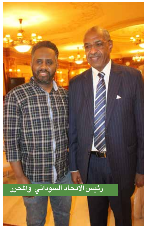
رئيس الاتحاد السوداني والمحرم