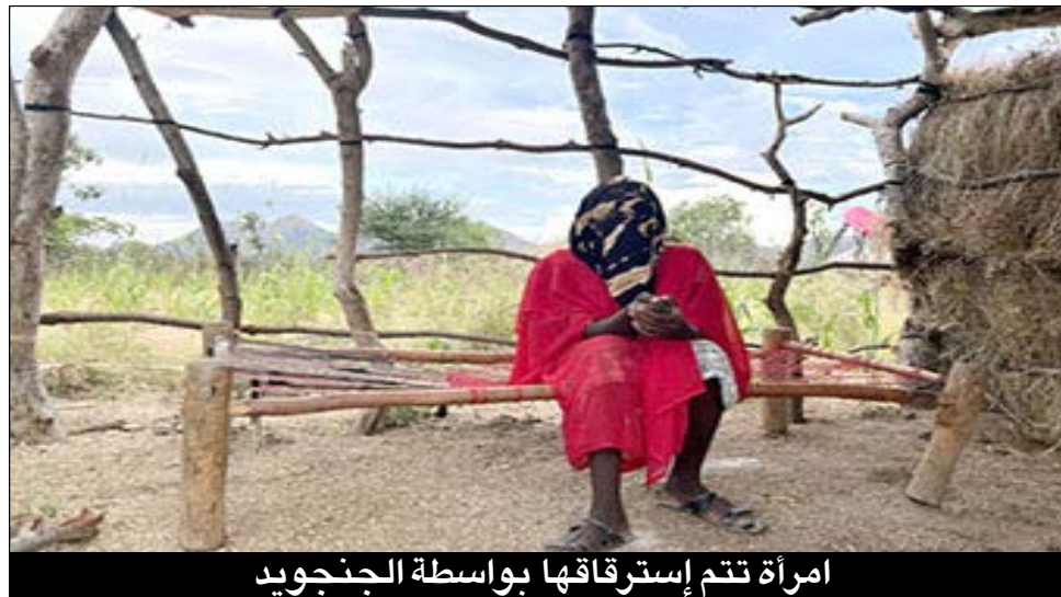
امرأة تتم إسترقاقها بواسطة الجنجويد

ويعتمدون فعل هذا المنكر امام عائلاتهم وأحفادهم من الأطفال الصغار؟.. لا يحدث ذلك لولا ان هناك خطة او تكتيك واضح مدروس متفق عليه من قادة المليشيا بإيعاز من سادتهم بدولة الشر لكسر شوكة الشعب السوداني الذين يعلمون جيدا مدى تمسكه بالتقاليد والأعراف السودانية والرجولة والنخوة والشهامة.