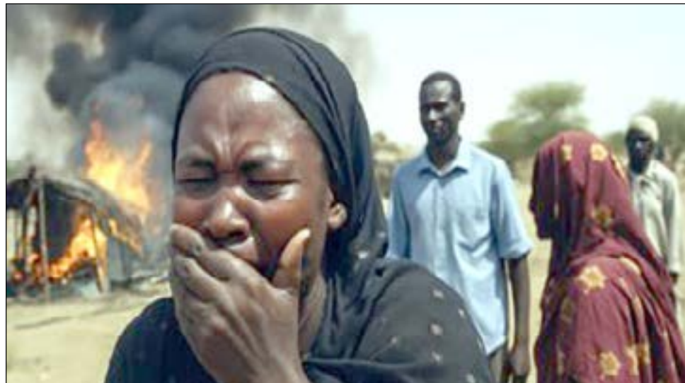
مخيم زمزم شهد حالات إغتصاب إنتقامية