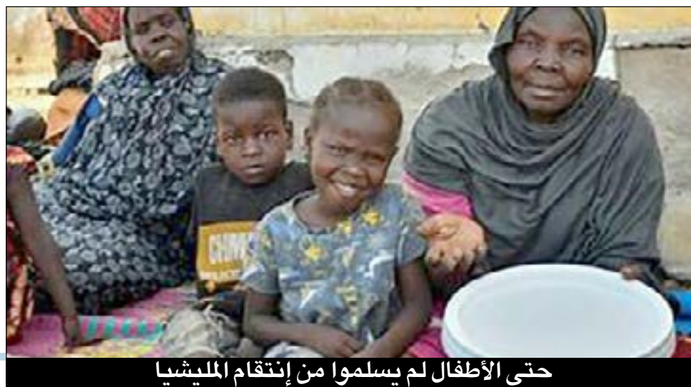
حتى الأطفال لم يسلموا من إنتقام المليشيا

لاحظت كما لاحظ الكثيرون ان اول جريمة كانت ترتكبها مليشيا الدعم السريع إبان إحتلالها للعاصمة السودانية الخرطوم تمثلت في الهجمة المسعورة على النساء خاصة الفتيات ومنهن قاصرات وإغتصابهن.. نفس الأمر حدث بولايات الجزيرة وسنار ودارفور وكردفان.. (أصداء سودانية) تكشف من خلال هذا التحقيق الأسباب الخفية للإغتصابات الجماعية الممنهجة التي مارسها قوات الدعم السريع للنساء والفتيات السودانيات بالقرى والمدن التي كانت تحت سيطرتها