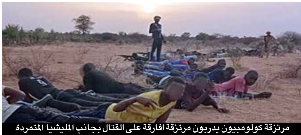
مرتزقة كولومبيون يدربون مرتزقة إفارقة على القتال بجانب الميليشيا المتمردة