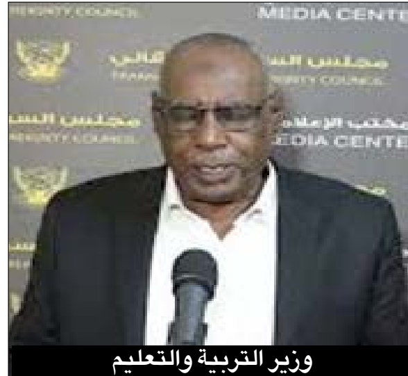
وزير التربية والتعليم

مرشد نفسي: الاغتصاب من القضايا التي شلت الميديا وارقت الاسر