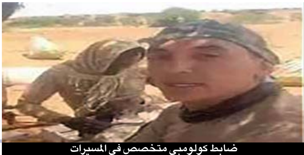
ضابط كولومبي متخصص في المسيرات