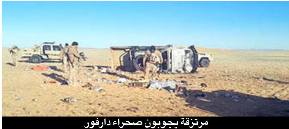
مرتزقة يجوبون صحراء دارفور

الافريقية، وهذه تعرف نفسها في إعلاناتها عبر الإنترنت بالوكالات الأمنية، (للتمويه)، مدعية ان من مهامها إدارة برامج تدريبية عسكرية وأمنية لصالح بعض الدول الأفريقية.. ونجحت الوكالة او الشركة الإماراتية في إستقطاب عدد كبير من الراغبين في العمل كحراس أمنيين بالمنشآت الإماراتية المختلفة داخل وخارج الإمارات بسبب الرواتب العالية التي أشارت لها إعلانات التوظيف عبر الإنترنت.. ويتم إرسالهم أولا للإمارات وكان معظمهم من دول افريقية مثل: (تشاد - النيجر - مالي - جنوب السودان) بعدها يتم إرسالهم للسودان للمشاركة في القتال بجانب الميليشيا المتمردة ضد الجيش السوداني.. وتعد وكالة الزعبي الإماراتية مسؤولة عن جلب آلاف المرتزقة للسودان للقتال في صفوف الميليشيا