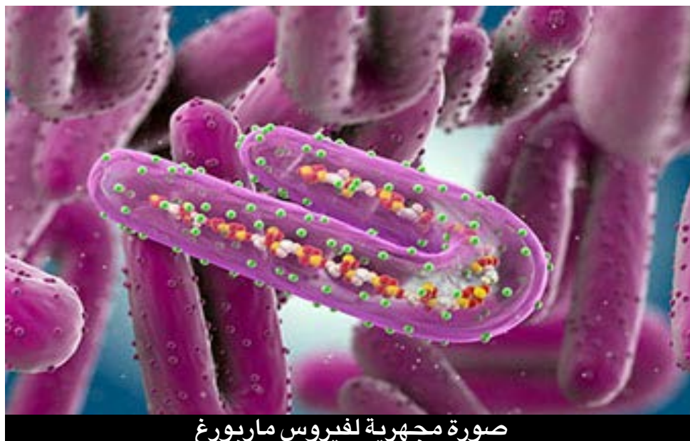
صورة مجهرية لفيروس ماربورغ

التقارير الطبية الوبائية الواردة من أثيوبيا تشير تسجيل 12 إصابة مؤكدة بفيروس ماربورغ بالمنطقة الجنوبية من