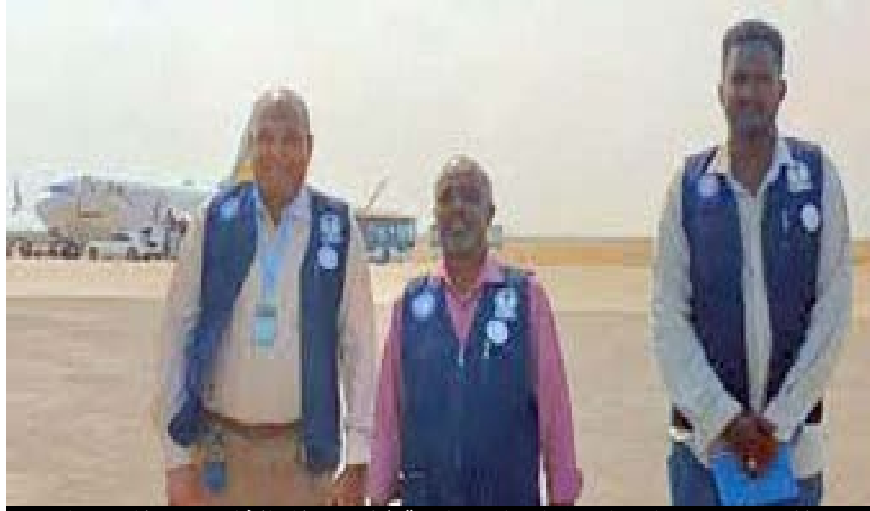
مطار بورتسودان.. إجراءات إحترازية لمنع تسلسل الفايروس للسودان

مع ملاحظة ان هذه العلاجات - كما أشار الأطباء - لا تضمن للمصاب الشفاء، ومن هنا فإن الوقاية تعد الوسيلة الأفضل لمكافحة الفيروس.. وليحمي شعب السودان من فيروس ماربورغ، طاعون الموت الأسود