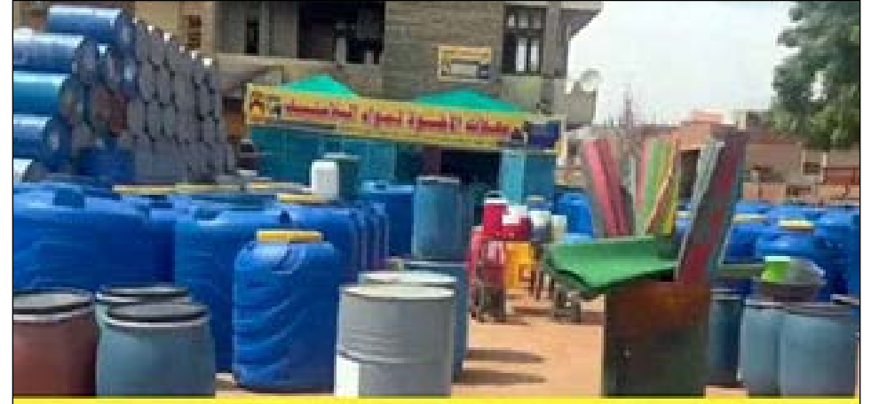
عودة متاجر سوق "أبو حمامة" بالخرطوم