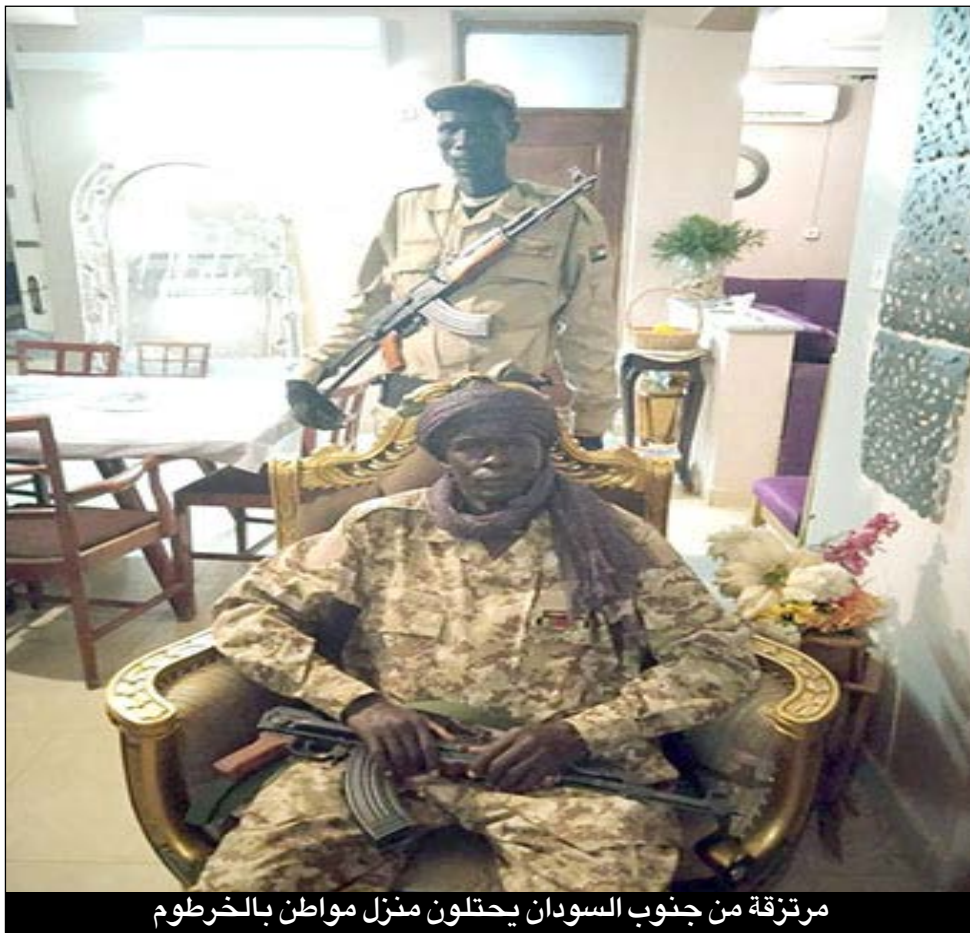
مرتزقة من جنوب السودان يحتلون منزل مواطن بالخرطوم

مرتزق هارب من القتال: الجيش السوداني شرس ولا يقهر ويعمل بتكتيك عسكري لم نشهد له مثيلا