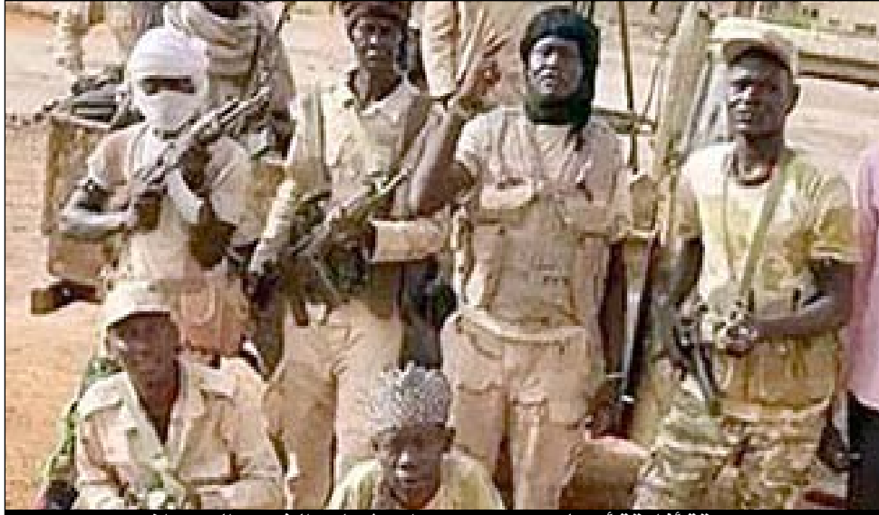
مرتزقة أفارقة أرسلهم محمد بن زايد لإبادة الشعب السوداني

شهود عيان من المرتزقة الأجانب الذين إنسحبوا من القتال في صفوف الدعم السريع ادلوا بشهادات وإفادات غريبة بقولهم: هناك أطباء كولومبيون يعملون لصالح الدعم السريع في حرب السودان يعملون كأطباء في تخصصات طبية مختلفة وممرضين بمستشفيات الدعم السريع بجانب تقديم الرعاية الطبية للجرحى والجنود الجرحى، وهم يديرين المستشفيات بالمدن الواقعة تحت سيطرة الدعم السريع بدارفور وكردفان ومنها مستشفى الفاشر والنهود.. وتورط بعض الأطباء المرتزقة في بعض الإنتهاكات مثل تعذيب المعتقلين والجرحى، وبعضهم تورط في تجاوزات طبية خطيرة بسرقة أعضاء الجرحى والمرضى، حيث نشطت مافيا الأعضاء البشرية مكونة من الأطباء المرتزقة الكولومبيين، حيث يقومون بإجراء عمليات جراحية غير ضرورية ليقوموا من خلالها بسرقة بعض أعضاء المرضى والجرحى الحيوية كالقلوب، والكلى، والقرنيات والكبد، وبعدها يعلنون وفاة المريض جراء بعض المضاعفات أثناء العملية الجراحية التي أجريت له، ويتم نقل الأعضاء البشرية المسروقة بسرعة عبر طائرات النقل الإماراتية التي تنقل العقاد الحربي للدعم السريع لبيعها لمافيا الأعضاء البشرية ببعض العواصم الأفريقية ومنها للدول الأخرى