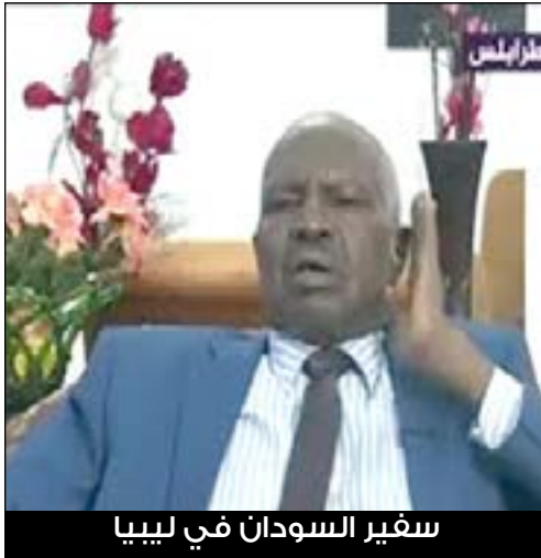
سفير السودان في ليبيا

* نكرر شكرنا للإخوة الليبيين على تعاونهم المنظم مع بعثنا الدبلوماسية ومع المواطنين وتقديمهم للخدمات ونرجو ان يوقفنا الله في تنفيذ العودة الطوعية لمواطنينا لبلادهم