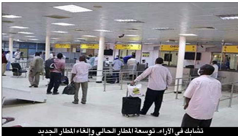
تشابك في الأراء.. توسعة المطار الحالي وإلغاء المطار الجديد

أخيرا، يتوقع بعض خبراء المطارات والطيران ان مطار الخرطوم الدولي الجديد - لو تم تشييده حسب التصور المقترح - سيكون طفرة في عالم المطارات، حيث