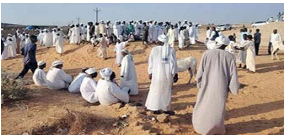
نفير من مواطني إحدى قرى غرب الجزيرة لردع المجرمين

غرب الجزيرة.. هل عادت مصابات السالف من جديد؟