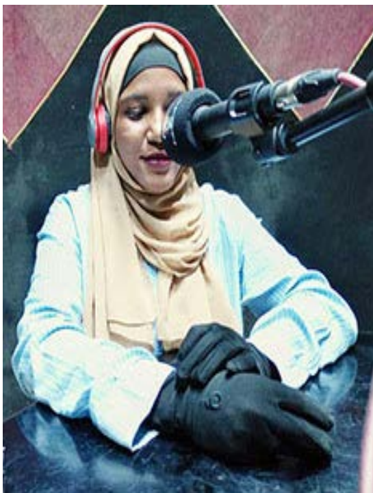
طالبة بكلية الإعلام جامعة سنار تتدرب بإذاعة سنجة

قبل سنوات قليلة ماضية كانت تجمع بين إذاعة الولاية وجامعة سنار توأمة في إنتاج البرامج بالإذاعة في عدد من المجالات، والقانون، والتنمية، والتكنولوجيا، وعلم الإدارة والبرامج الدينية، والزراعة، والطب وغيرها من المجالات، وكانت برامج ناجحة للغاية ولها عدد واسع من المهتمين والمستمعين.. ومن جانب الإذاعة كانت تقوم بتدريب طلاب كلية الاعلام بصورة دورية وتم اكتشاف مواهب كثيرة من الطلاب والطالبات.