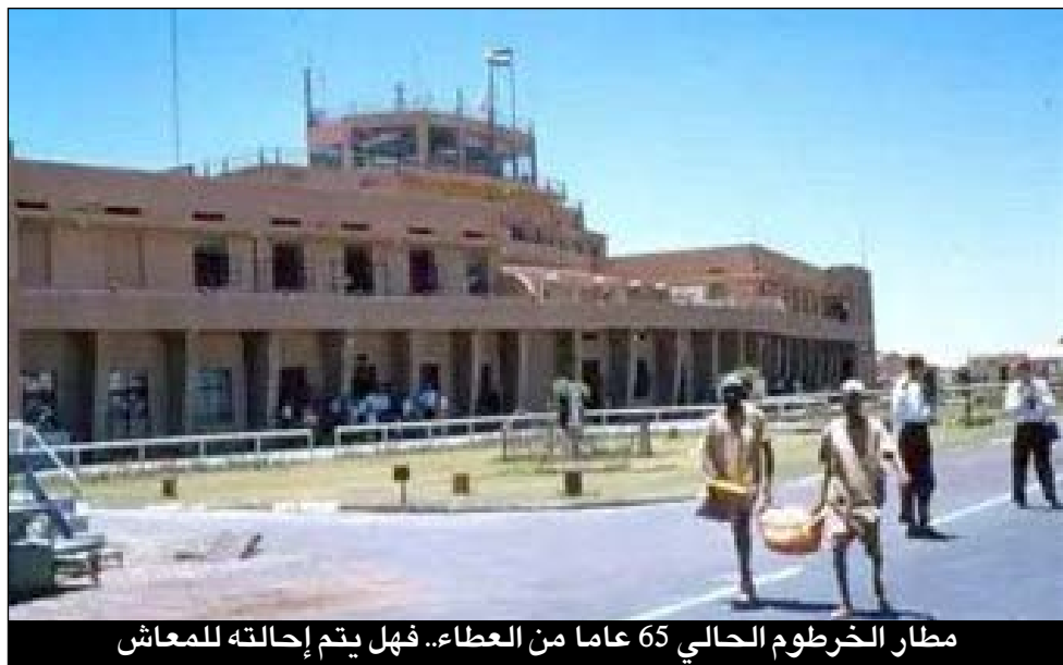
مطار الخرطوم الحالي 65 عاما من العطاء.. فهل يتم إحالته للمعاش

تحديات سياسية ومالية تسببت في تأخير التنفيذ سنينا عددا