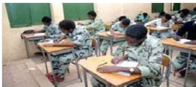
أوراق الإمتحان لا تكفي لتقييم الطالب فهي لا تقيس فهمها ولا إبداعا

أعيدوا البهجة إلى الصفوف، والإحترام إلى المعلم، والطمانينة إلى بيوت الأمهات أكتبها بصدق أم ترى أن مستقبل هذا الوطن يبدأ من مقعد المدرسة، وأن إصلاح التعليم اليوم هو إنقاذ الغد.. ولكم خالص التقدير والتجلة والإحترام معالي الوزير سهام أجد.. أم أنهكها المشهد التعليمي