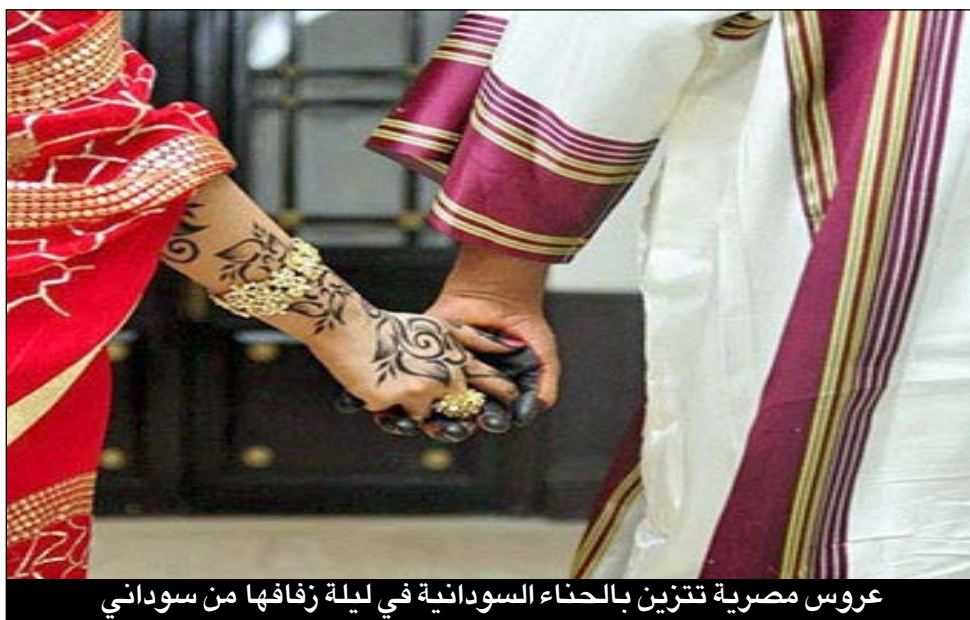
عروس مصرية تتزين بالحناء السودانية في ليلة زفافها من سوداني