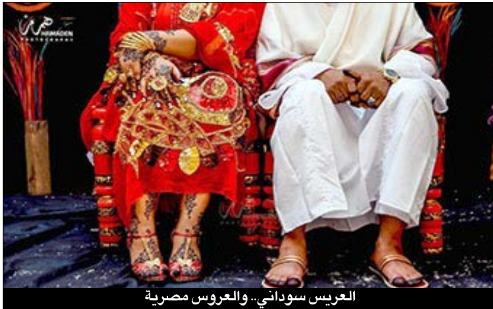
العريس سوداني.. والعروس مصرية

ولأن صورة زوجتي السودانية المتوفاة لم تفارق ذهني وخيالي، ونزولا لرغبة وإلحاح ابني بضرورة زواجي قررت الزواج مرة ثانية لكن من مصرية.. وافصحت عن رغبتني هذه لأحد أصدقائي المصريين والذي توطدت علاقتي به داخل مسجد الحارة حيث كنا نؤدي معا الصلوات بالمسجد، فأختر لي امرأة مصرية أرملة ليس لديها أبناء، وكانت ذات خلق ودين، كثيرة التردد للصلاة وترتيل القرآن الكريم بنفس المسجد الذي تعودت الصلاة فيه مع صديقي المصري، وحقيقة أعجبت بها وببدينها وبأخلاقها الرفيعة.. فصارحتها بمساعدة صديقي المصري رغبتني في الزواج بها على سنة الله ورسوله، فأبدت موافقتها وطلبت مني مقابلة معها حيث ان زوجها متوفى.. وكان صديقي عمليا إذ قادني مساء نفس اليوم عقب صلاة العشاء لمنزل أسرته وقابلنا معها طالبا الزواج منها.. وبعد جلسة ودودة قضيناها معه سال خلالها عن أحوالي، وأين سيكون بيت الزوجية، ومصدر دخلي، فأجبتني أنني بالمعاش ولدي عدد من المنازل المؤجرة والتي تدر علي دخلا محترما بجانب مساعدة ابني الوحيد لي والذي يعمل مهندسا بالملكة العربية السعودية.. بعدها قال انه لا مانع لديه من الزواج بشرط سؤال ابنة أخيه عن رأيها ولما سألتها أمامنا مباشرة أبدت له موافقتها على الزواج بي.. ثم سألتها: «السوداني سوف يعود لبلده السودان بعد انتهاء الحرب فهل أنتي مستعدة للعيش معه بالسودان؟» فأبدت له موافقتها.. ومن ثم تم عقد القران والأن نعيش معا في نفس الشقة بالفيصل والتي كنت أعاني فيها من الوحدة والعزلة، وحقيقة أكرمني الله بهذه الزوجة المصرية المتدينة المطيعة لي.. فالشكر لله ولابني لإصراره المتواصل على زواجي، والذي وصل من السعودية خصيصا لحضور حفل الزواج المتواضع الذي أقمناه وكان أكثر الحضور سعادة بزواجي»