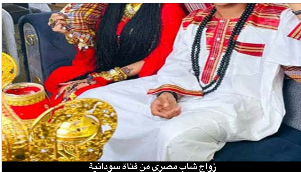
زواج شاب مصري من فتاة سودانية

النزوح من السودان كنا نقيم بمنطقة عين شمس في شقة صغيرة مكونة من غرفتين وصالة صغيرة، لم أتصور أن قسمتي في الزواج ستكون مع مصري.. كنت أتردد على بقالة قرب منطقتنا السكنية وكان صاحب المتجر شاب من صعيد مصر يتميز بخلق رفيع ومعاملة طيبة مع السودانيين الذي يقطنون بمنطقة عين شمس.. وبعد تردي على متجره عدة مرات لشراء بعض حاجياتنا اليومية فوجئت به يطلب الزواج مني على سنة الله ورسوله، وكان في منتهى الصراحة معي، أخبرني أنه متزوج من ابنة عمه وتقيم بقريةهم بصعيد مصر، ورزقه الله منها بولد وبنت.. فسألته لماذا يرغب في الزواج بي بالذات والسودانيات بمصر كثيرات من النازحات؟.. أجاب: «حقيقة جذبتني شخصيتك القوية وجمالك الهادئ وحسن أدبك وتدينك».. فطلبت منه منحي مهلة أفكر فيها.. وحقيقة الشاب المصري مهذب ومتدين وهو يشبه في تعامله