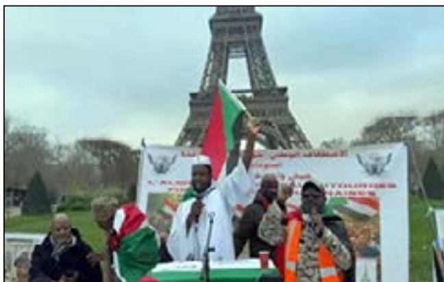
تظاهرات في باريس