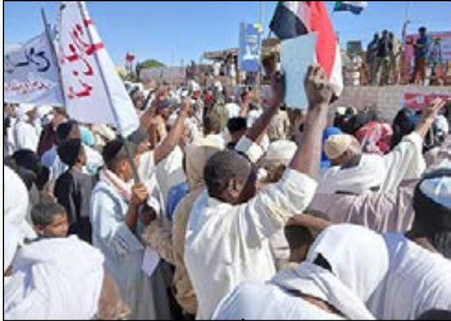
مدينة بورسودان تحتشد لدعم القوات المسلحة