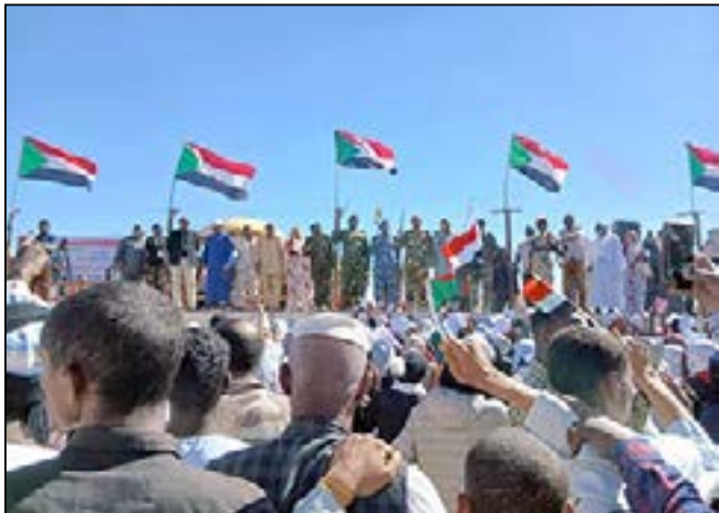
عطبرة تتظاهر لنصرة القوات المسلحة