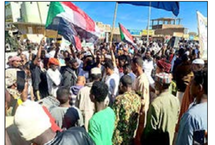
حلفا تشهد جشود جماهيرية كبيرة دعماً للقوات المسلحة