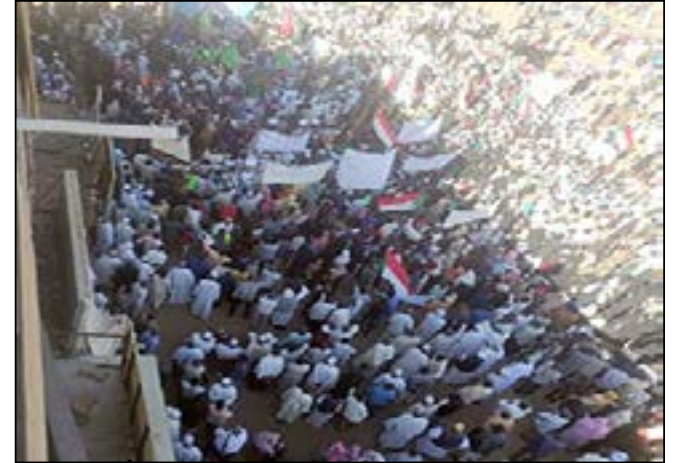
الخرطوم تخرج في تظاهرات حاشدة