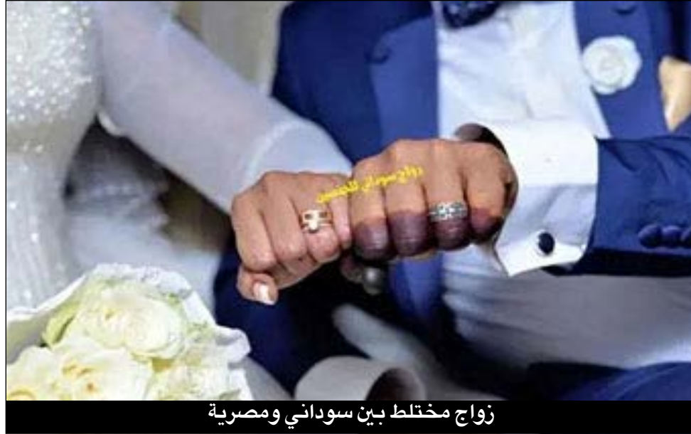
زواج مختلط بين سوداني ومصرية

القانون المصري يمنع زواج المصريات من الأجانب إذا كان فارق العمر بينهما أكثر من 25 سنة