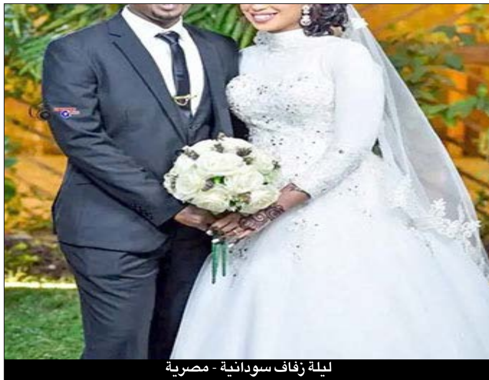
ليلة زفاف سودانية - مصرية

جدل واسع يدور حول جنسية الأبناء من الزواج المختلط، حيث يواجه الأبناء صعوبات تتعلق بشكل رئيسي بالجنسية