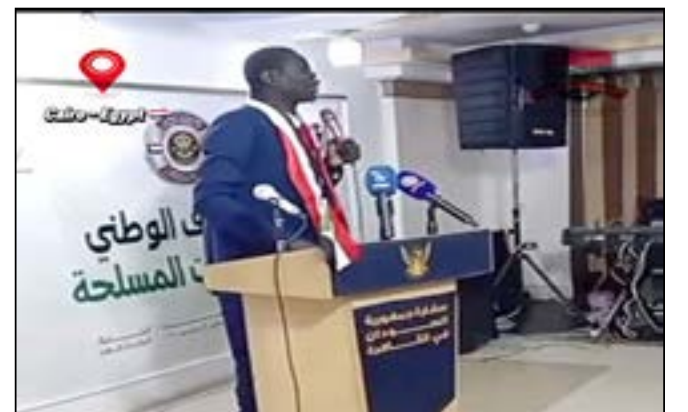
السودانيون في القاهرة يحتفلون ببيت السودان في يوم الاصطفاف الوطني