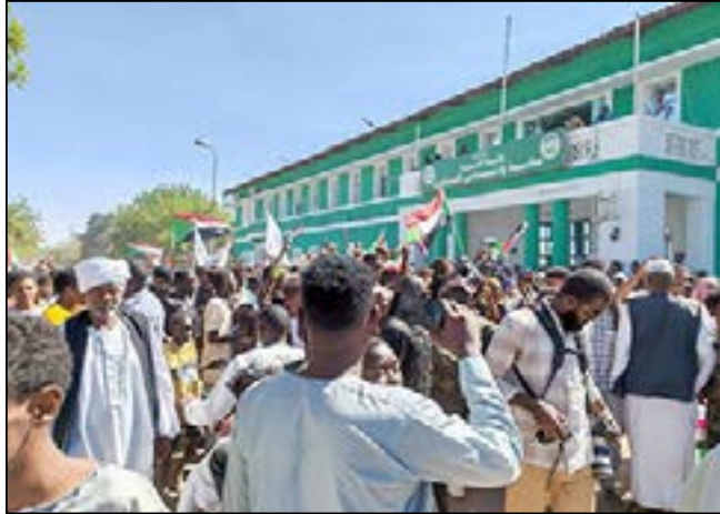
الجزيرة تتظاهر لنصرة القوات المسلحة