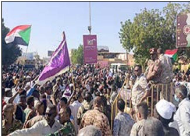
دنقلا تحتفل بيوم الاصطفاف الوطني