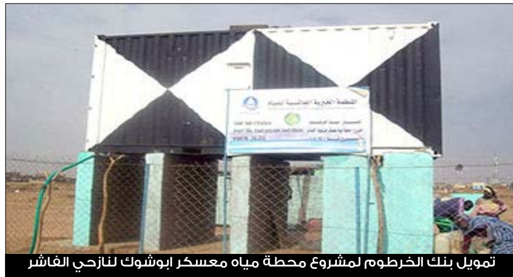
تمويل بنك الخرطوم لمشروع محطة مياه معسكر أبوشوك لنازحي الفلشر