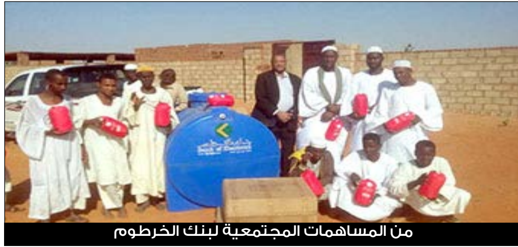
من المساهمات المجتمعية لبنك الخرطوم

يعتمد ما ورد أعلاه في التقرير على المعلومات والأرقام الموثقة من مصادر رسمية وإعلامية عن بنك الخرطوم، بما في ذلك موقع البنك وتقاريره، ومقالات تحليلية، وبيانات الجوائز والتصنيفات الدولية