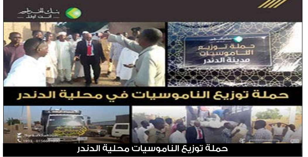
حملة توزيع الناموسيات محلية الدندر