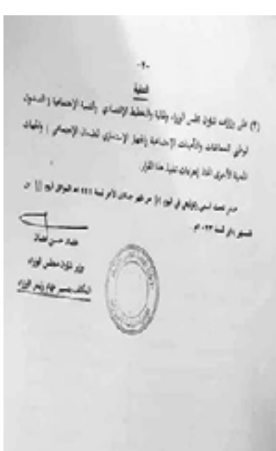
القرارات التي لم تنفذ المنح والاستحقاقات