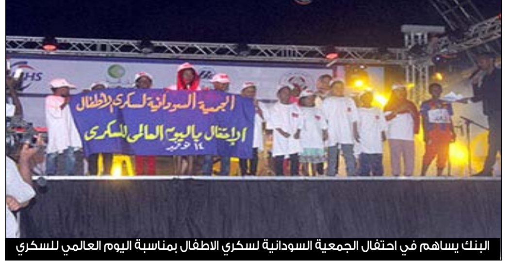
البنك يساهم في احتفال الجمعية السودانية لسكري الاطفال بمناسبة اليوم العالمي للسكري