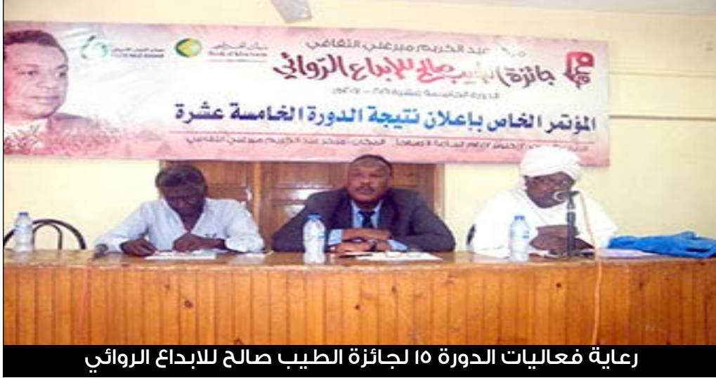
رعاية فعاليات الدورة ١٥ لجائزة الطيب صالح للإبداع الروائي