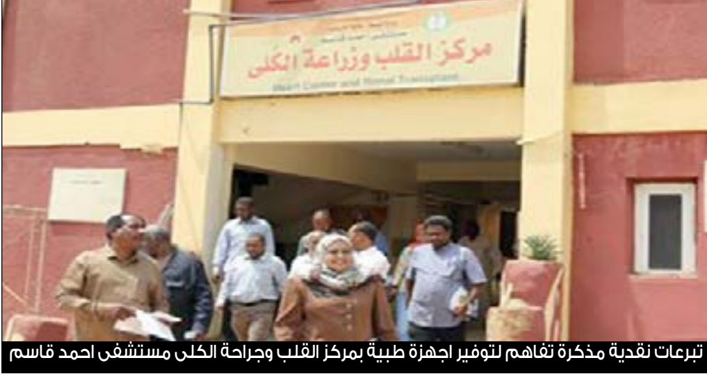
تبرعات نقدية مذكرة تفاهم لتوفير أجهزة طبية بمركز القلب وجراحة الكلى مستشفى احمد قاسم