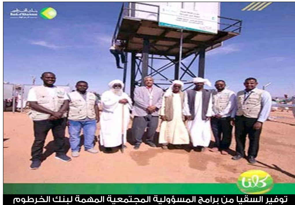
توفير السقيا من برامج المسؤولية المجتمعية المهمة لبنك الخرطوم

المجتمع عبر تقديم المساعدات الإنسانية والبرامج التعليمية والصحية.. وتعزيز النمو الاقتصادي من خلال خلق فرص العمل والاستثمار في المشاريع التنموية، وتحسين جودة الحياة بتوفير الخدمات الأساسية مثل الصحة والتعليم يؤمن بنك الخرطوم بأن دوره الريادي يكتمل من خلال برامج المسؤولية، حيث عكف بنك الخرطوم، منذ تأسيسه عام 1913، على أن يكون شريكاً