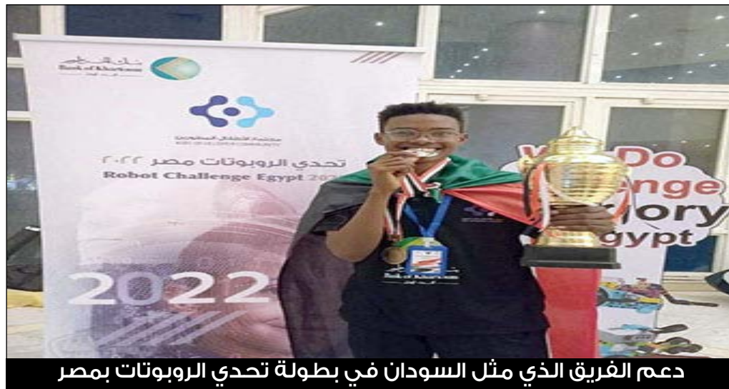
دعم الفريق الذي مثل السودان في بطولة تحدي الروبوتات بمصر