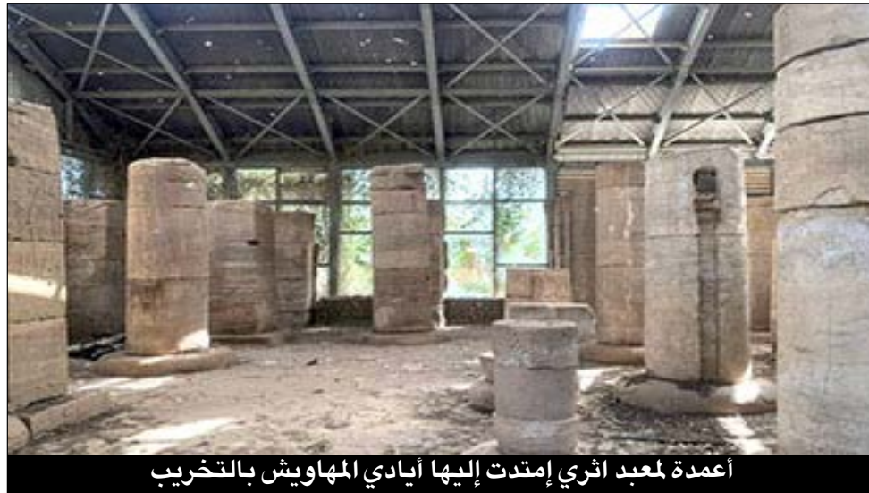
أعمدة لمعبد أثري إمتدت إليها أيادي المهاويش بالتخريب

عمدا ومعظمها من القطع الأثرية كبيرة الحجم، بأكثر من 110 ملايين دولار امريكي