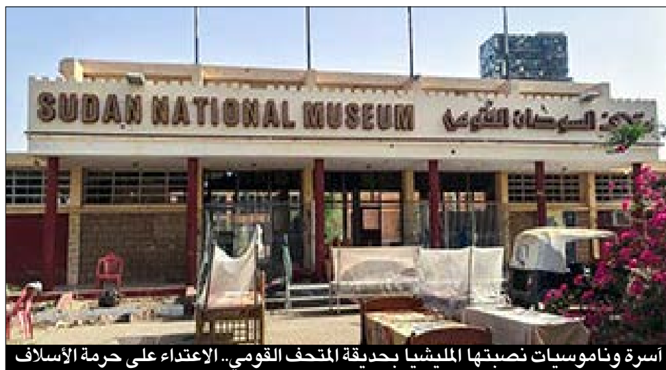
أسرة وناموسيات نصبها المليشيا بحديقة المتحف القومي.. الاعتداء على حرمة الأسلاف

صراحة ودون مواراة، الامارات تسعى جاهدة لطمس الهوية السودانية بهدف إستعمار السودان عبر مخلصها مليشيا الدعم السريع لنهب موروثه الثقافي ولطمس ذاكرة الأمة السودانية.. ومن أهم القطع التي تم نهبها آلاف التماثيل الجنائزية الكوشية المصنوعة من البرونز والحجر الأسود المشغولة بالذهب والأحجار الكريمة، حيث قام أفراد المليشيا الذين إقتحموا المتحف القومي بنزع الذهب والأحجار الكريمة منها، بجانب نهب التماثيل الحجرية الصغيرة.. وتحظى التماثيل الكوشية بإقبال كبير في أسواق الآثار العالمية غير الشرعية، لجمالها وصغر حجمها وسهولة تحريكها من مكان لآخر وإخفائها، والأهم من ذاك كله قيمتها الأثرية والتاريخية الكبيرة.. ونهب آثار السودان يعتبر (جريمة حرب) لكونها دمرت آثارا ومقتنيات تؤرخ للحضارة السودانية التي تمتد لأكثر من 7 آلاف عام.. وتقدر الهيئة القومية للآثار والمتاحف قيمة الآثار المسروقة وتلك التي تحطمت وأتلفت