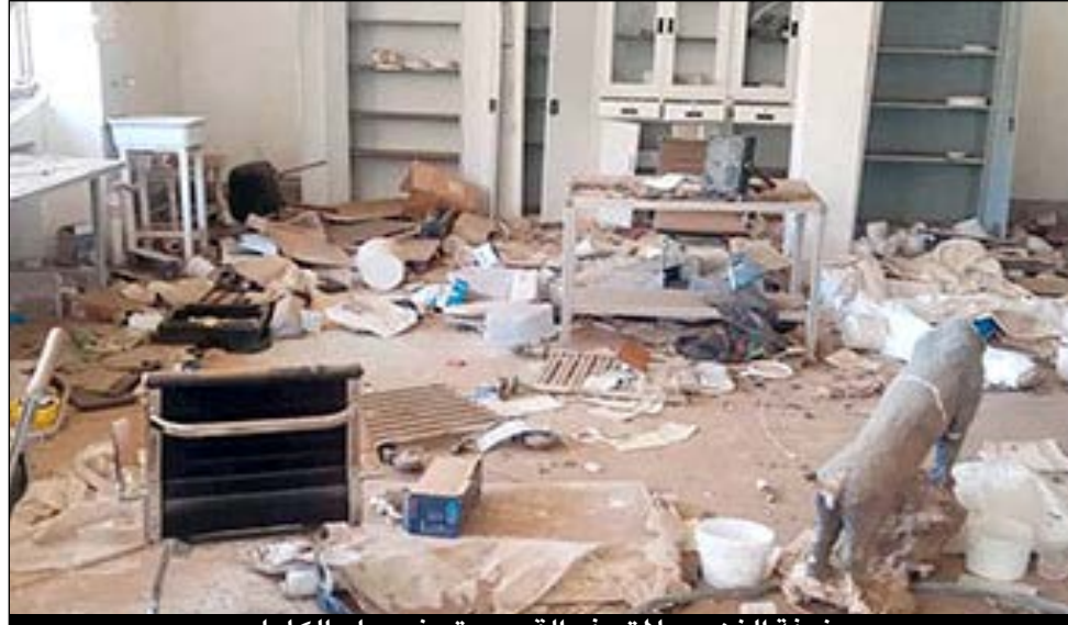
غرفة الذهب بـ المتحف القومي تم نهبها بالكامل