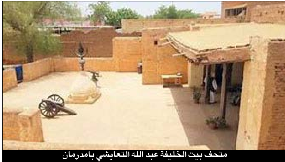
متحف بيت الخليفة عبد الله التعايشي بامدرمان

والصور الفوتوغرافية التاريخية القديمة.. أبيض واسود - والخرائط التاريخية الموغلة في القدم.. والحمد لله نجت دار الوثائق القومية من النهب والتدمير، خاصة أرشيف الصحف السودانية والمجلات والكتب والدراسات والوثائق السودانية فلم يتعرض لخسائر جسيمة.. ولكن في المقابل تم نهب مخطوطات إسلامية من دار الوثائق تشمل نسخ قديمة من القرآن الكريم والمخطوطات الدينية والوثائق التاريخية التي تتعلق بتاريخ السودان السياسي والإقتصادي