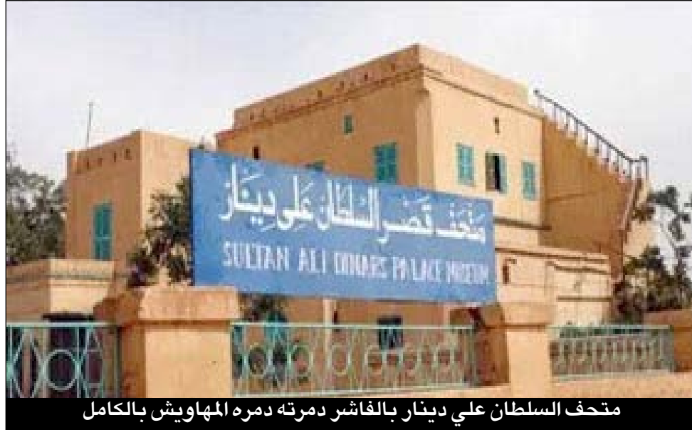
متحف السلطان علي دينار بالفاشر دمرته دمره المهاويش بالكامل