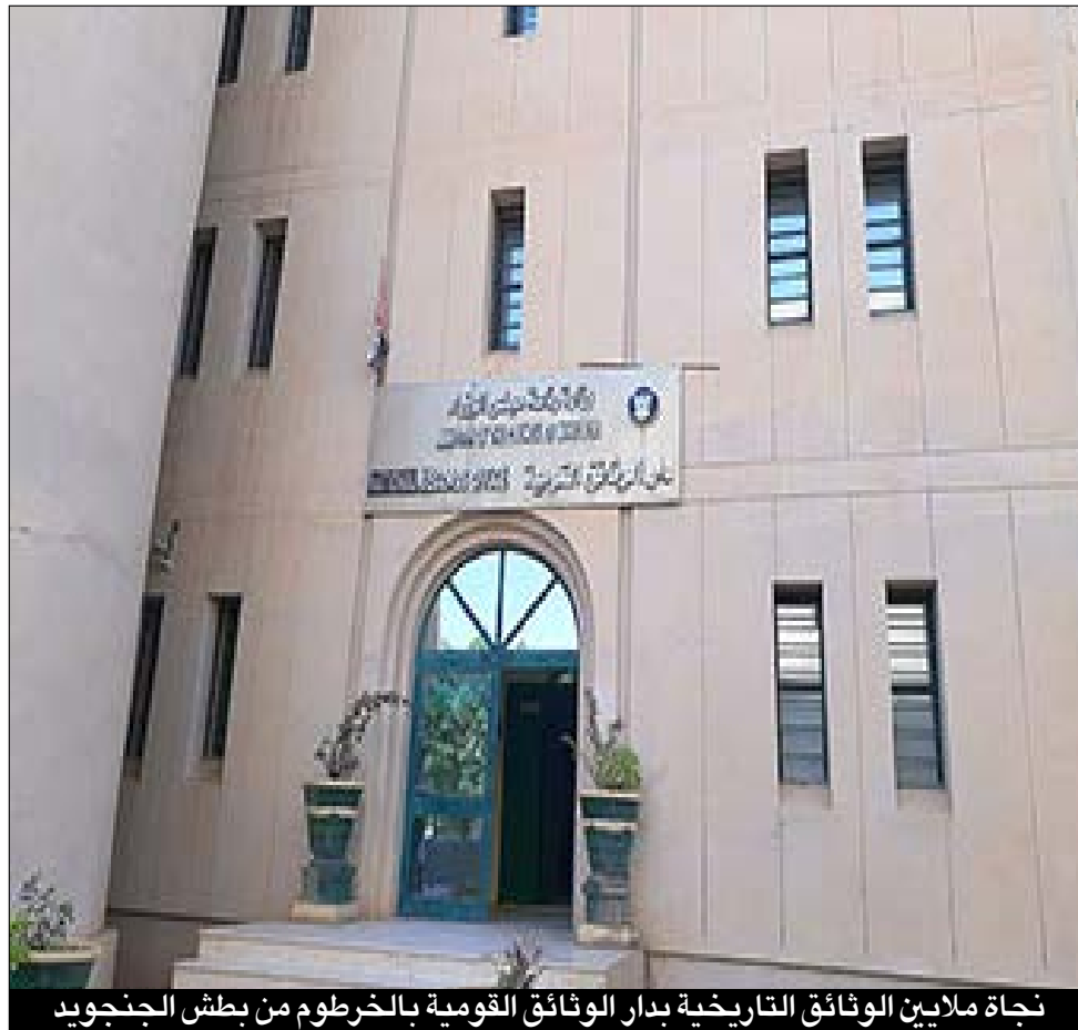
نجا ملايين الوثائق التاريخية بدار الوثائق القومية بالخرطوم من بطش الجنجويد

ومجلات ونشرات وكتب وإعلانات ومكاتبات ورسائل حكومية وقرارات رسمية هامة.. وصور تاريخية نادرة توثق للحكومات السودانية المتعاقبة ولتلك المرتبطة بفترة الإستعمار البريطاني.. ولمعرفة أن دار الوثائق القومية هي ذاكرة الأمة السودانية نشير إلى أنها تحتفظ داخلها بأرشيف يحتوي على حوالي 30 مليون وثيقة، منها وثائق تاريخية من عصر سلطنة سنار، وملكة دارفور، والفترة المهديّة، والحكومات الوطنية منذ الإستقلال، بجانب