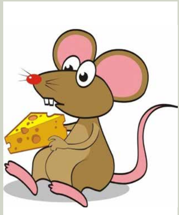
ليه الامهات بدسوا الخبيز واللبن