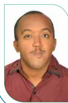
بقلم /رامي الكرني

في بريطانيا، كان ريشي سونك اول باكستاني شغل منصب رئاسة الوزراء من (2022-2024)، هاجر والده إلى بريطانيا عام 1966، بعد أن كان مستقرا