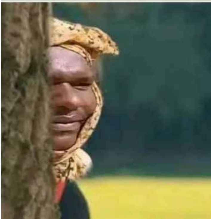
الخبير الاصطراطيحي (قجة)

- الجنجويد قالوا الخرطوم فيها (جيماوي).. طلع بكتل الفيران.. وبغيز لون الموية والجنجويد