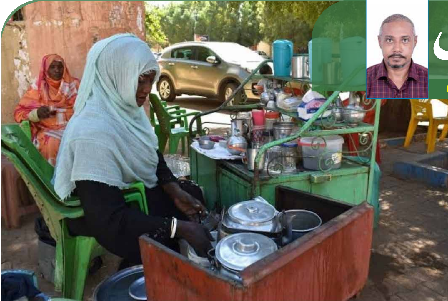
مدينة سودانية مقسومة على اثنين

- ناس منتظرة 14 فبراير وناس منتظرة 18 فبراير اللهم بلغنا الفي مرادنا.