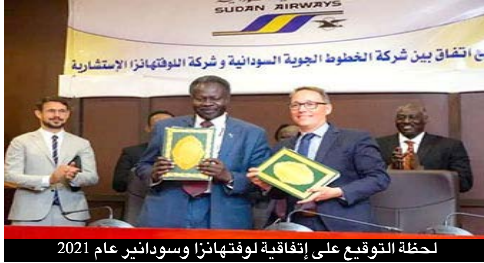
لحظة التوقيع على إتفاقية لوفتهانزا وسودانير عام 2021

خبراء طيران: إجازة قانون الشركة أبرز المطلوبات لإعادة سودانير لسيرتها الأولى