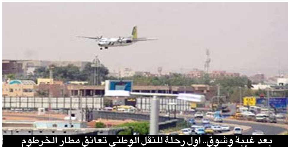
بعد غيبة وشوق.. أول رحلة للنقل الوطني تعانق مطار الخرطوم