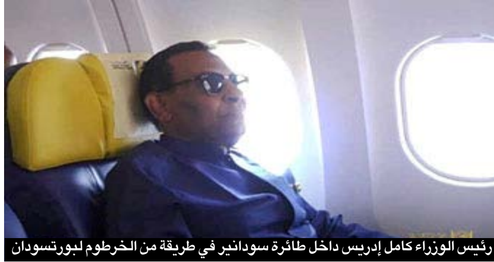
رئيس الوزراء كامل إدريس داخل طائرة سودانير في طريقة من الخرطوم لبورسودان

وإرتبط في الذاكرة السودانية بالسفر الآمن والخدمة الراقية.. غير انها خلال العقود الماضية شهدت إنهيارا مخيفا نتيجة الإهمال وسوء الإدارة وقضايا الفساد التي خربت بنيتها وأثارت لغطا واسعا في الشارع السوداني، فتراكمت عليها الأزمات الإدارية والمالية، بجانب الإضطرابات السياسية والعقوبات الإقتصادية، وضعف البنية التحتية، إنعكس كل ذلك سلبا على سودانير ففقدت اسطولها الجوي، وخرجت من قائمة شركات الطيران المسموح لها بالتحليق في أجواء دول الإتحاد الأوروبي.. بجانب بعض القيود الفنية والتقنية التي أثرت على قدرتها التنافسية وسمعتها الإقليمية والدولية.