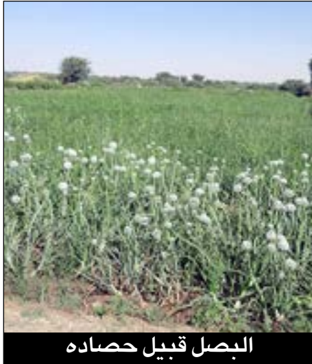
البصل قبيل حصاده