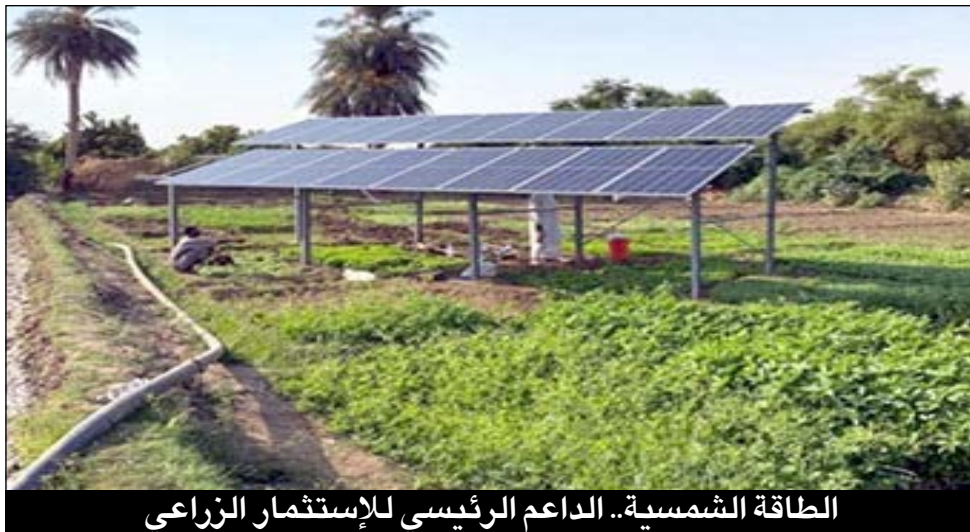
الطاقة الشمسية.. الداعم الرئيسي للإستثمار الزراعي

إستناداً على تجربة المشاريع الزراعية بمنطقة حسيانرتي محلية الدبة الولاية الشمالية، والتي جاءت في سياق التحقيق الصحفي الميداني بحلقاته الثلاث من داخل تلك المشاريع وأراء المستثمرين والمزارعين هناك والذين باشروا ري مشاريعهم ومحاصيلهم وبساتينهم بمنظومة الطاقة الشمسية، نخلص لنتيجة مفادها، أن الطاقة الشمسية في المشروعات الزراعية ليست حلاً سحرياً مطلقاً، بل (خيار إستراتيجي) ناجح إذا أحسن التخطيط له وجرى تقييم عيوبه وتحدياته الفنية والاقتصادية بدقة، مع مراعاة حجم المشروع، وطبيعة المحاصيل، والظروف المناخية المحلية.. وعلى الدولة بأجهزتها المختصة العمل على تسهيل منظومة الطاقة الشمسية للمزارعين والمستثمرين، وضبط أسعارها في الأسواق، والتي لاحظنا أنها إرتفعت لأرقام فلكية بعد إشكالية الإمداد الكهربائي المعروفة بسبب الحرب، خاصة بالمناطق الزراعية.