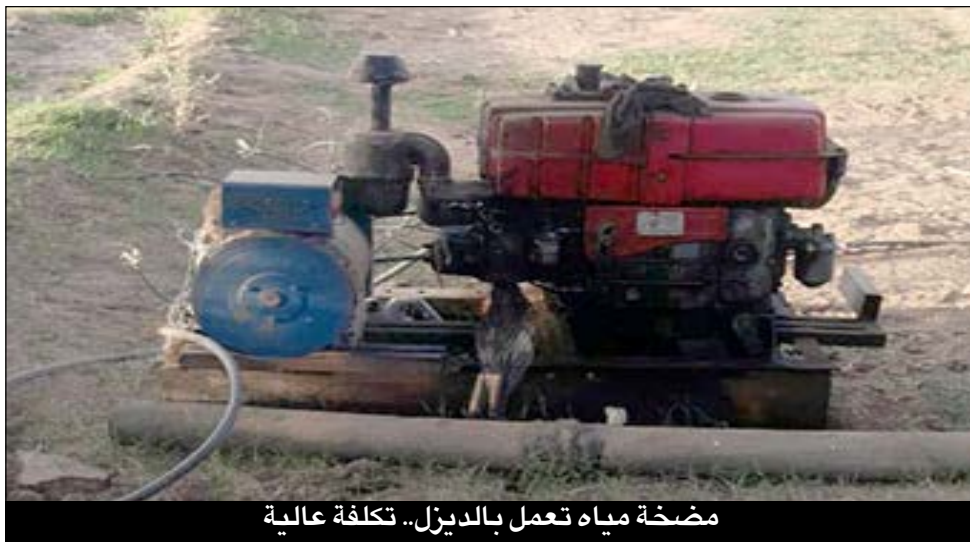
مضخة مياه تعمل بالديزل.. تكلفة عالية

حيث التكلفة الاقتصادية نظام الري بالديزل في مرحلة الشراء الأولية، فيما أن نسبة إنخفاض تكلفة الطاقة الشمسية في المشروعات الزراعية قد تصل 50% من حيث خفض التكلفة الفعلية بعد التشغيل والإنتاج.. وقدمت الدراسة أرقاماً تقديرية لتكلفة الري لكل فدان في السياق السوداني، مستندة إلى دراسات محلية وعالمية كالآتي: