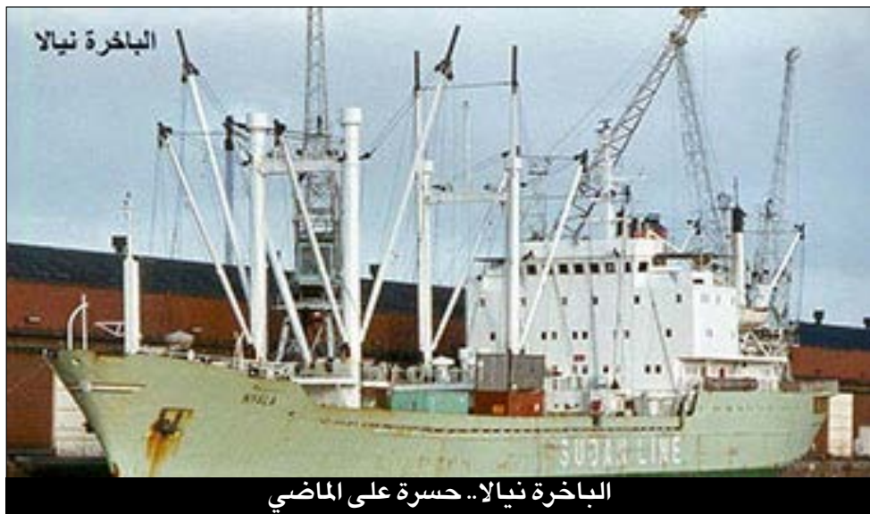
الباحرة نيالا.. حسرة على الماضي

- تحقيق صحفي غير مسبوق يتتبع ملامح أفول التراث الشعبي بالولاية الشمالية، لا بوصفه حنينا رومانسيا للماضي، بل باعتباره سؤالاً جوهريا عن الهوية والذاكرة والقطيعة بين الأجيال. - ماذا يحدث حين تنسحب الذاكرة من الحياة اليومية بلا ضجيج؟ - هنا لا يموت التراث فجأة، بل يذبل ببطء كما تذبل نخلة تركت بلا ماء. - اليوم يقر كثير من كبار السن بانهم آخر الحراس لذاكرة تتآكل.