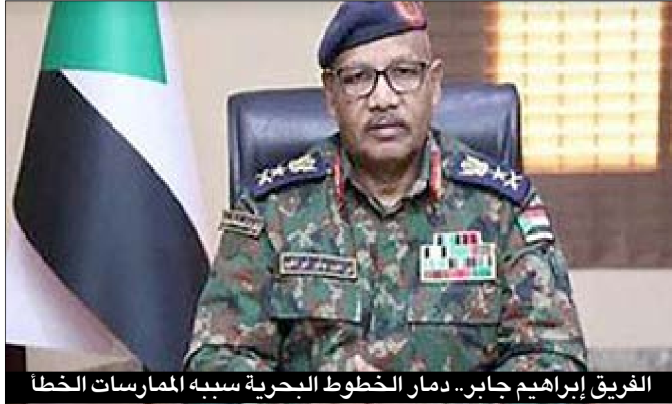
الفريق إبراهيم جابر.. دمار الخطوط البحرية سببه الممارسات الخطأ

الفريق إبراهيم جابر: الدمار الذي لحق بالخطوط البحرية كان بسبب الممارسات الخاطئة التي تسببت في هجرة الكفاءات والكوادر المؤهلة