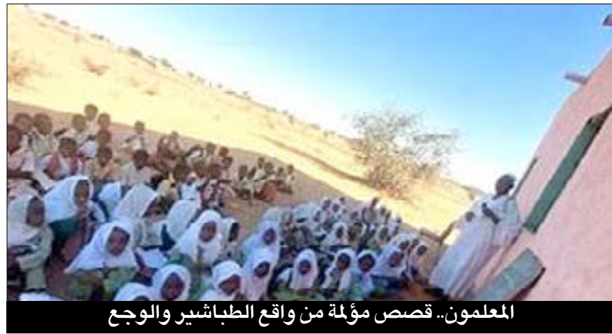
المعلمون.. قصص مؤلمة من واقع الطباشير والوجع