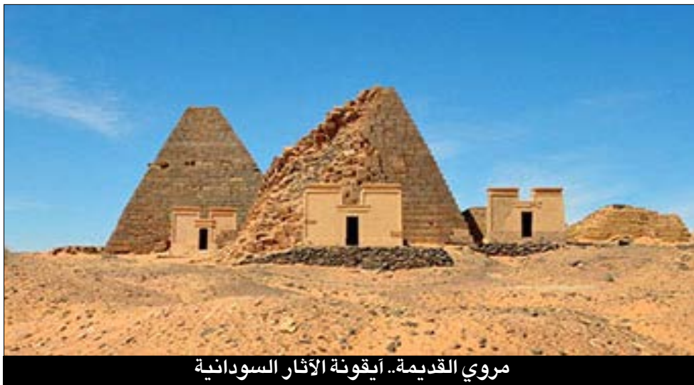
مروي القديمة.. أيقونة الآثار السودانية

حماية الآثار لا تتحقق بالجهود الحكومية وحدها بل بإشراك المجتمعات المحلية والإعلام