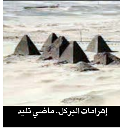
إهرامات البركل.. ماضي تليد

يمكن أن تتحقق بالجهود الحكومية وحدها، بل تتطلب أيضاً إشراك المجتمعات المحلية في عملية الحماية، فالمواطن الذي يعيش بالقرب من موقع أثري يمكن أن يكون خط الدفاع الأول عنه إذا أدرك قيمته وأهميته. ويؤكد بعض الباحثين أن تعزيز الوعي المجتمعي بأهمية التراث قد يساهم في تقليل التبعيات من خلال برامج التوعية في المدارس ووسائل الإعلام، إلى جانب إشراك سكان المناطق في مشاريع سياحية أو ثقافية مرتبطة بالمواقع الأثرية.