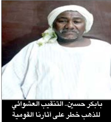
بابكر حسين.. التنقيب العشوائي للذهب خطر على آثارنا القومية