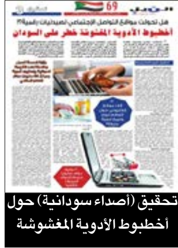
تحقيق (أصداء سودانية) حول أخطبوط الأدوية المغشوشة

وأكد مصدر طبي مسؤول يعمل في الحقل الصحي بالمحلية أن جميع الحالات التي تم رصدها ثبتت إيجابيتها بالفحص المعلمي الدقيق، الأمر الذي يعكس انتشاراً مقلقاً للمرض في المنطقة، مشيراً إلى ضرورة تحرك الجهات المعنية بصورة عاجلة للحد من تفشي المرض قبل أن تتفاقم الأوضاع الصحية.. ودعا المصدر السلطات الصحية بمحلية الدبة إلى تضافر الجهود لمكافحة نواقل الأمراض، عبر تنفيذ حملات رش واسعة للبعوض، والعمل على طمر البرك والمستنقعات التي تشكل بيئة مناسبة لتكاثر البعوض الناقل للملاريا، إلى جانب تكثيف حملات التوعية الصحية وسط المواطنين.. ويأتي هذا الارتفاع في ظل تجارب سابقة شهدتها المنطقة مع موجات من الحميات الوبائية، حيث سُجلت في إحدى الفترات الماضية 546 حالة إصابة بمحلية الدبة و26 حالة وفاة ضمن أمراض الحميات، وذلك عقب موسم إحدى الفيضانات التي ساهمت في إنتشار البعوض وتكاثر نواقل الأمراض.. ويحذر الأطباء ان إستمرار ارتفاع الإصابات دون تدخلات عاجلة قد يؤدي إلى تحول المنطقة إلى (بؤرة) لانتشار وتصدير الملاريا لكل الولاية الشمالية.. ربنا يسلم الجميع.