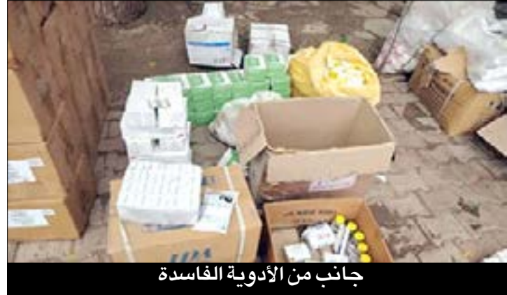
جانب من الأدوية الفاسدة

عصابة إجرامية في هذه الجريمة النكراء.. وعلى إدارة الصيدلة مراجعة صيدليات الدواء والتأكد من الأشخاص الذين يعملون داخلها في بيع الأدوية للمواطنين، وسوف يكتشفون العجائب العجائب، حيث هناك (باعة) أدوية وليس (صيادلة)، يقومون بقراءة الروشحات العلاجية وصرف الدواء للمرضى، وبعضهم لا يعرف حرفاً واحداً من الإنجليزية، إن لم تكن العربية أيضاً.. عموماً المتهمين الثلاثة الآن أمام العدالة بعد إكمال التحريات، ونعتقد أن في مثل هذه الجرائم النكراء ينبغي أن يكون العقاب مغلظاً بما يتناسب بحجم وخطورة الجرم.