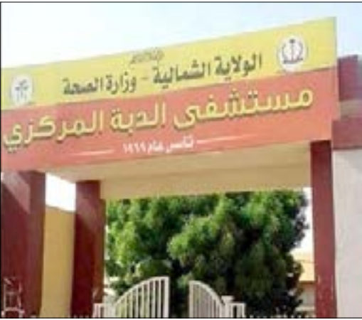
مستشفى الدبة المركزي.. مجهود مقدر لإستقبال وعلاج مرضى الملاريا

التضامن .. إرتفاع (مُزعج) لإصابات الملاريا