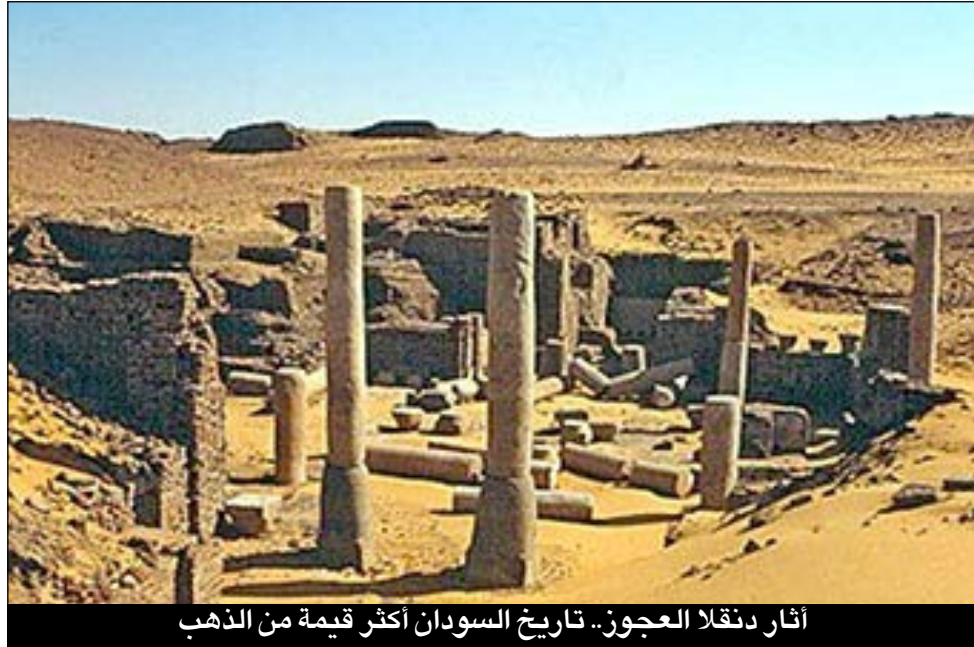
آثار دنقلا العجوز.. تاريخ السودان أكثر قيمة من الذهب

خبراء آثار: الحفر العشوائي للدهابة يدمر السياق التاريخي للمواقع الأثرية