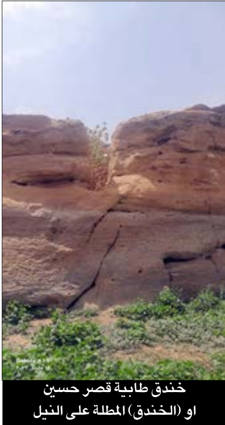
خندق طابية قصر حسين أو (الخندق) المطلة على النيل