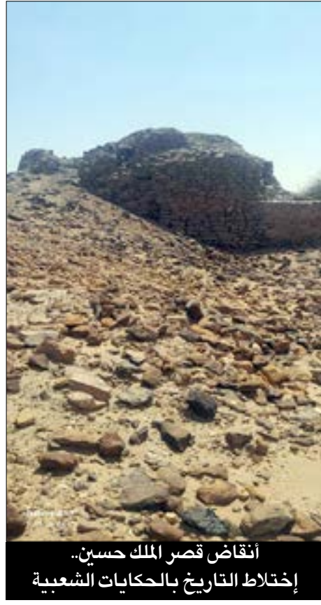
أنقاض قصر الملك حسين.. إختلاط التاريخ بالحكايات الشعبية

أبناء المنطقة مجرد خرافة لا سند لها.. وعلى مسافة لا تتجاوز عشرة أمتار من القصر، يبرز خندق أو (طابية) منحوتة في صخرة رملية مطلة على النيل، يقال إنها كانت منصة لإطلاق المدافع الكبيرة دفاعاً عن القصر ضد أي عدو قد يأتي عبر النهر، وفق ما توارثه كبار السن من روايات الأجداد.. وهكذا يقف الموقع اليوم بين