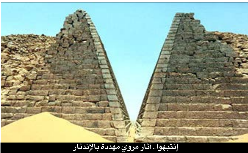
إنتهبوا.. آثار مروى مهددة بالإنذار

الحقيقة والأسطورة، منتظراً من يكشف أسرارها ويعيد قراءة تاريخه قبل أن تبتلعه عوامل الزمن والإهمال.